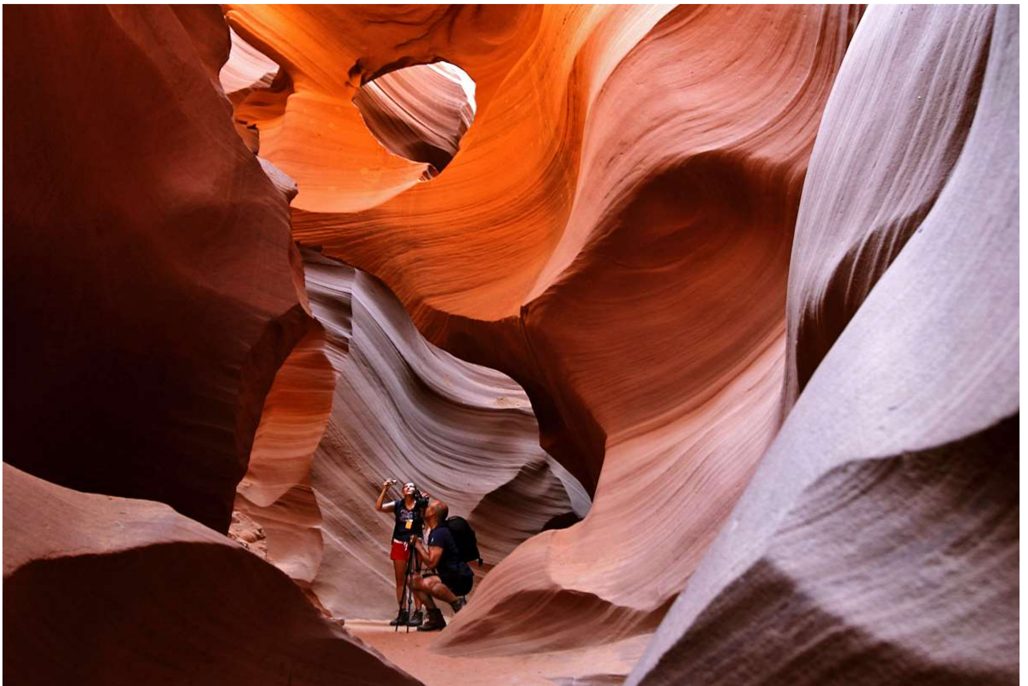
Каньон Антилопы, расположенный в горах Пэйдж, получил свое название, благодаря рыже-красным стенам, напоминающим кожу антилопы. В течение нескольких столетий вода и ветер вытачивали и формировали изящные и причудливые рельефные линии внутри скал.