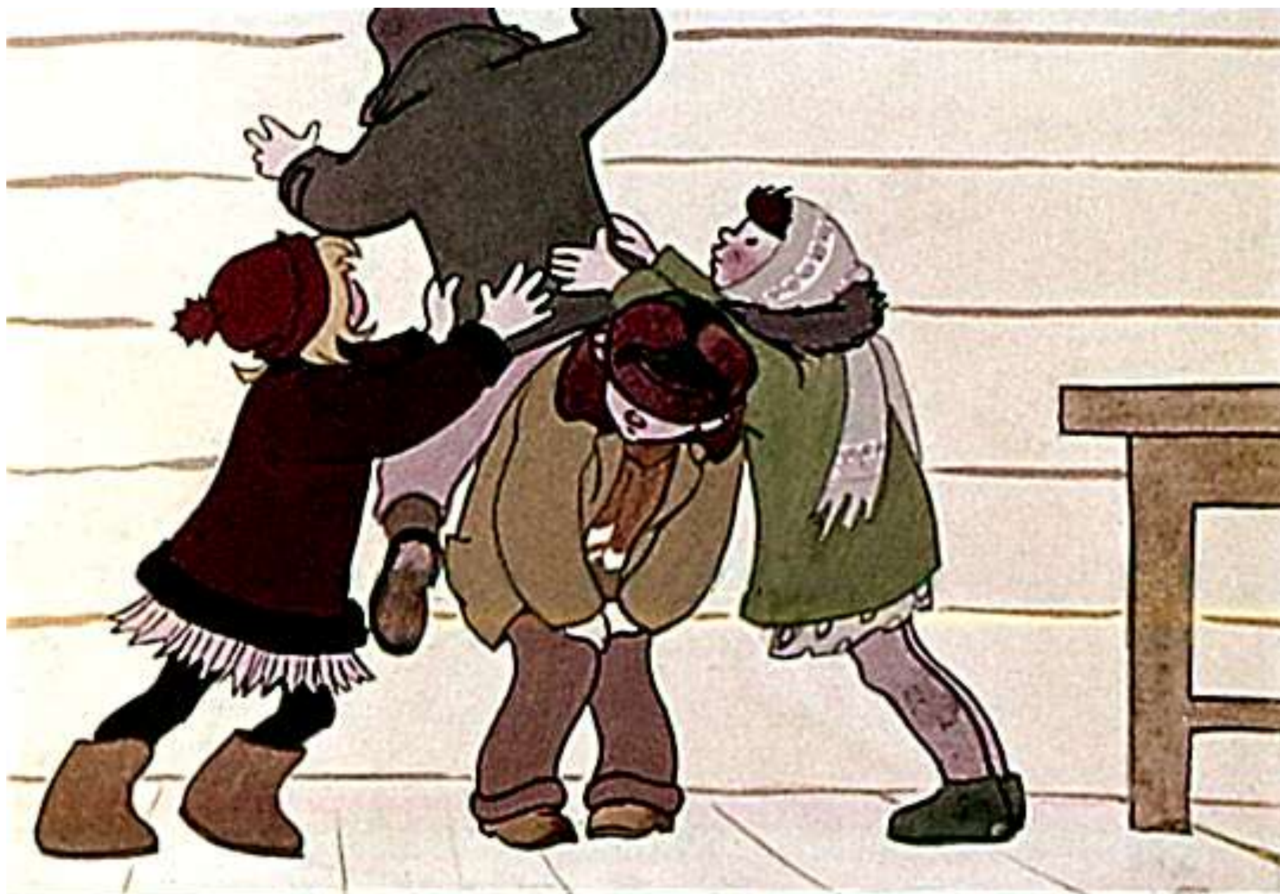
Подняли товарищи Петю на руки.