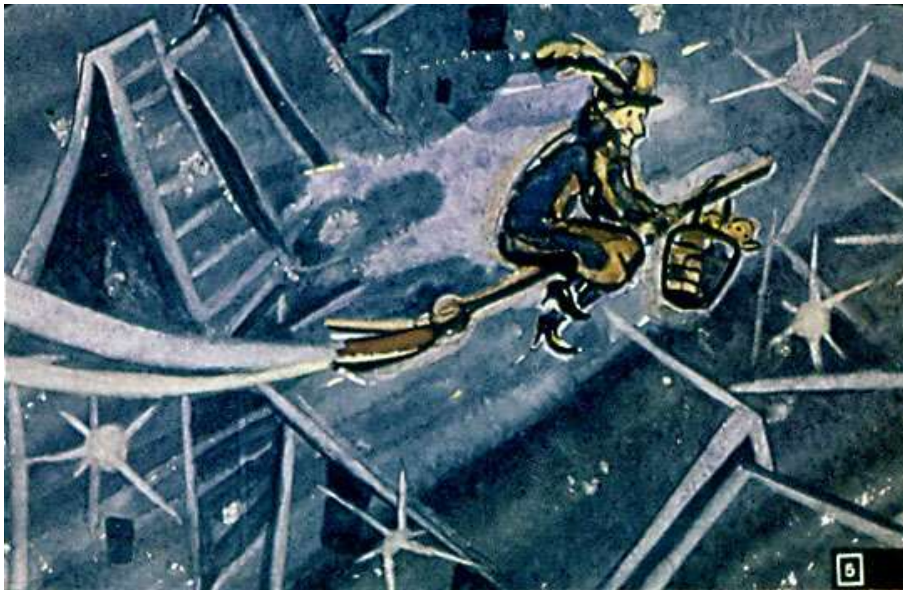
В новогоднюю ночь Фея на метле развозила детям подарки.