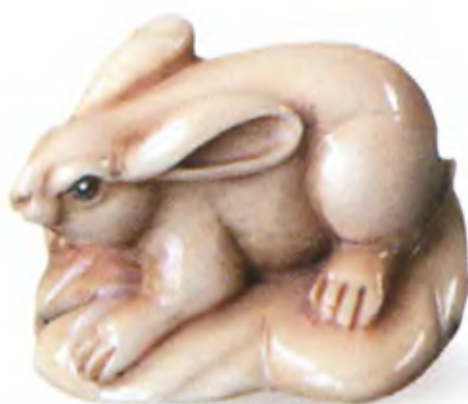
Кролик. Япония, 19 в., мастер Йошито-мо, резная кость

Традиция подавать лепешки мочи к столу в первый день Нового года зародилась в Японии в период Муромати (1392—1573). Одну из лепешек помещали поверх другой. Потом большая лепешка разрезалась на части, которые затем съедались членами семьи. Такой обряд должен был ублажить духов и принести счастье в дом. Этот обряд сохранился и в современной Японии.