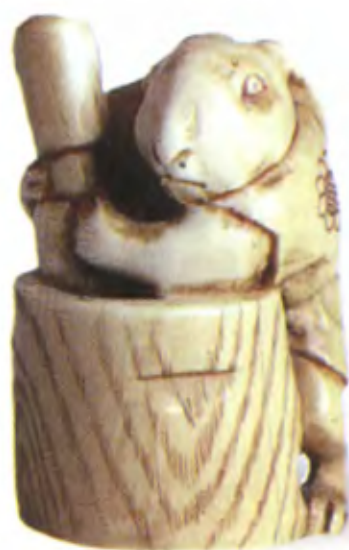
Лунный кролик со ступой. Япония, конец 19 в., мастер Эичи, резная кость