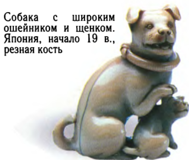
Собака с широким ошейником и щенком. Япония, начало 19 в., резная кость