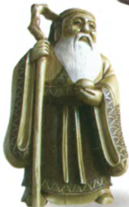
Окимоно «Дзюродзин с персиком». Япония, 19 в., мастер Йошитомо, резная кость