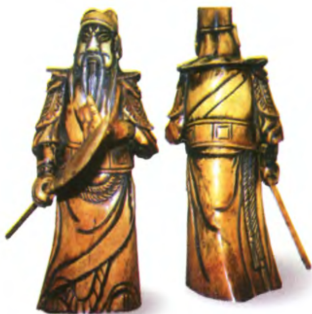
Гуань Юй. Япония, конец 18 в., автор неизвестен, слоновая кость

Как это часто бывает, образ бесстрашного воина в народном сознании превратился в символ универсального заступника. Легенды приписывали Гуань Юю способность вызывать во время засухи дождь, останавливать наводнения, усмирять демонов и ограждать людей от болезней. Говорят, что он может появиться у постели больного и вложить в руку страждущего волшебные исцеляющие золотые пилюли.