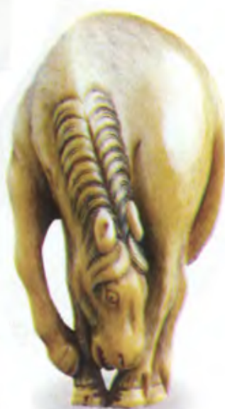
Пасущаяся лошадь. Япония, начало 19 в., резная кость