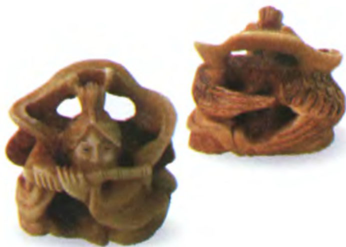
Окимоно Бэnten. Япония, 19 в., мастер Гиокузан, резная кость