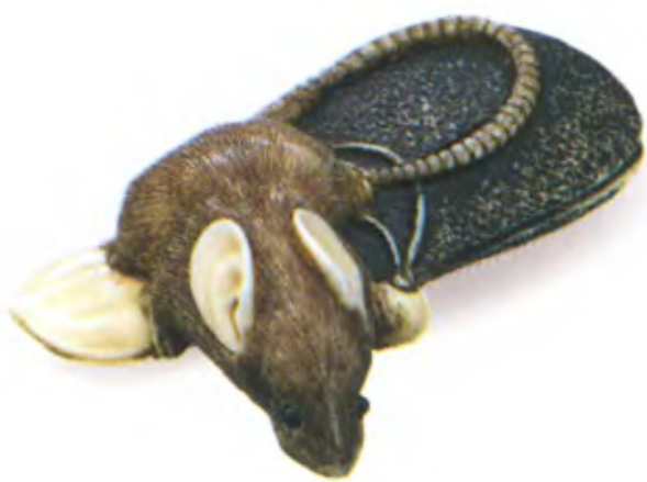
Крыса на кисете с табаком. Япония, середина 19 в., мастер Гиокумин, резная кость