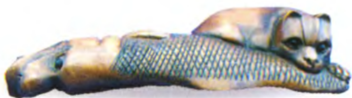
Кот с рыбой. Япония, 19 в., резное дерево