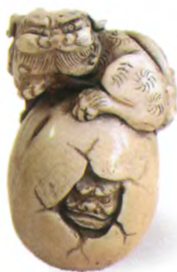
Шиши, выводящиеся из яйца. Япония, 19 в., мастер Садахиро, резная кость