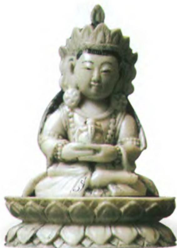
Будда Амитабха. Япония. 19 в., резная кость

Образ Амитабхи был известен не только буддийским монахам, которые обращались к нему с молитвенными возгласами «Амито-фо», но и среди простых крестьян. Скорее всего, такая популярность Амитабхи была вызвана связями, которые возникали между его образом и мечтами о возрождении после неизбежной кончины, которая завершает путь земных страданий. Постепенно распространяясь, культ Амитабхи стал популярен в Южной Сибири, Монголии и на территории Китая. Дошел он и до Японии, где этот будда, известный под именем Амида, почитался весьма высоко. Образ Амитабхи-Амиды был известен резчикам нэцкэ. Впрочем, они не слишком часто обращались в своем творчестве к этой фигуре индийского пантеона, предпочитая изображать синтоистских богов и демонов, которые были более близки сердцу японцев.