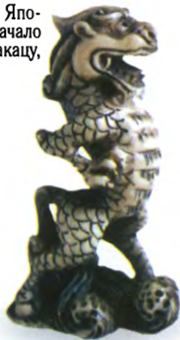
Дракон кирин. Япония, 19 в., мастер Шозан, резная кость