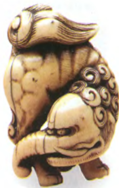
Баку. Япония, 18 в., резная прокрашенная кость

Согласно другой версии, распространение образа баку в Японии связано с императором Гоэдзей (1586—1611). Именно он начал дарить своим придворным фигурки такарабунэ — корабля сокровищ, на котором находились семь богов счастья. Среди них был страж Севера Бисямонтен и покровительница музыки богиня Бэндзайтен. Божество Дайкоку, которого часто изображают с мешком, на котором сидят крысы, олицетворяло изобилие. С мешком, полным богатства, на корабле плыл и странствующий монах Хотей. Рядом с ним — божества долголетия и мудрости Дзюродзин и Фукурокудзю. Завершал семерку бог удачи Эбису, которого часто изображали с удочкой и пойманной волшебной рыбой. Самое любопытное, что на парусе такарабунэ был изображен баку. С тех пор в Японии существует традиция класть под Новый год под подушку не только фугурку такарабунэ, но и изображение баку — защитника от плохих сновидений.