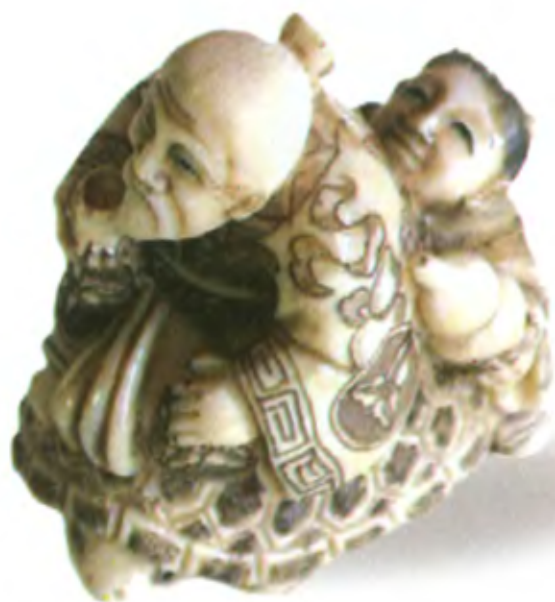
Дзюродзин и мальчик на черепахе. Япония, 19 в., мастер Гиокуши, резная кость