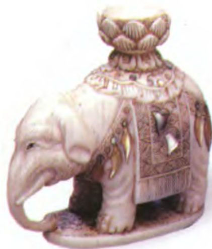
Слон. Япония, конец 19 — начало 20 в., мастер Соичи, резная кость с перламутровыми вставками