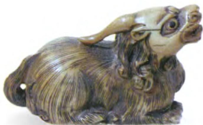
Дракон кирин. Япония, 19 в., мастер Шушин, резная кость

Драконы очень богаты и щедро делятся своими накоплениями. Единственная ценность, которая не оставляет их равнодушными, — крупная жемчужина, которая является символом мудрости. Не случайно мастера нэцкэ нередко вырезали фигурку дракона, держащего в лапе жемчужину.