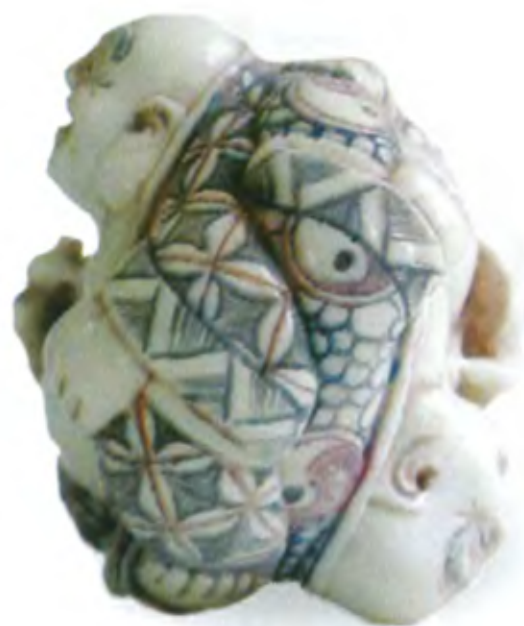
Двойной Хотей. Япония, 19 в., мастер Ямагучи, резная кость

После кончины в начале X в. и последующей канонизации монах Ци Цы порой стал считаться Майтреей — очередным воплощением Будды. Его приход в мир должен привести к эре гармонии, процветания и благополучия. Такие представления еще более связывали образ Хотей с воплощением счастья и беззаботности. Хотей иногда называют «толстым» или «смеющимся Буддой» и изображают в окружении беззаботно веселящихся детишек.