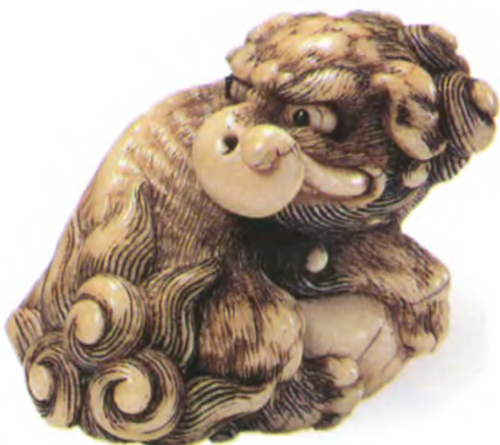
Баку. Япония, 18 в., резная кость с инкрустацией