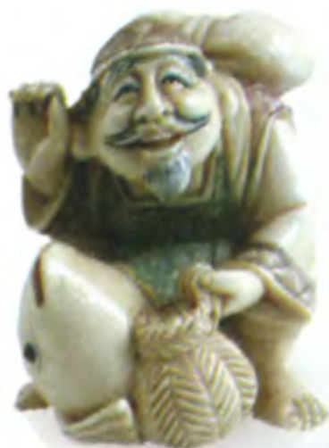
Эбису с пойманной рыбой. Япония, 20 в., мастер Ямагучи, резная кость