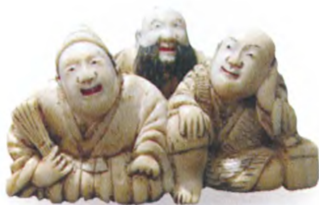
Урасима Таро (справа), Миура Осуке (слева) и сэннин Тобосау (в центре). Япония, 19 в., резная кость