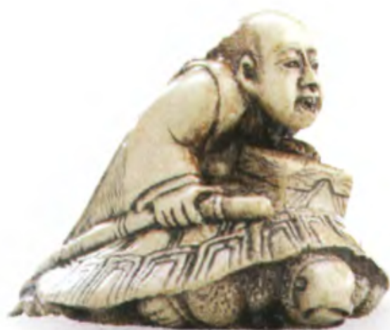
Урасима на черепахе. Япония, 19 в., резная кость