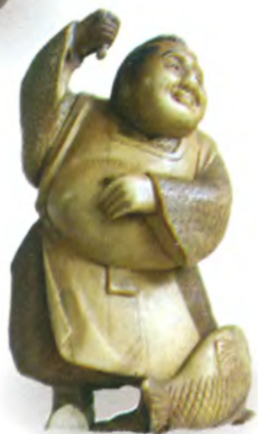
Эбису с рыбой. Япония, 19 в., резная кость