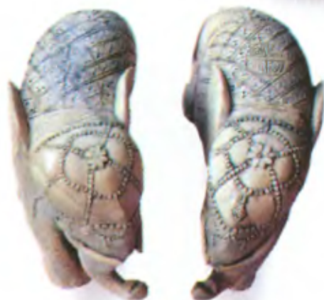
Пара слонов. Китай, конец 19 — начало 20 в., резная кость