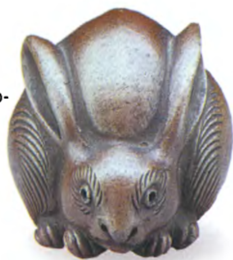
Кролик. Япония, 19 в., резной камень