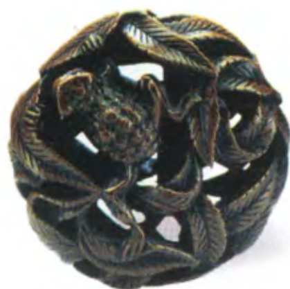
Жаба среди листьев. Япония, первая половина 19 в., мастер Тоимаса, резное дерево