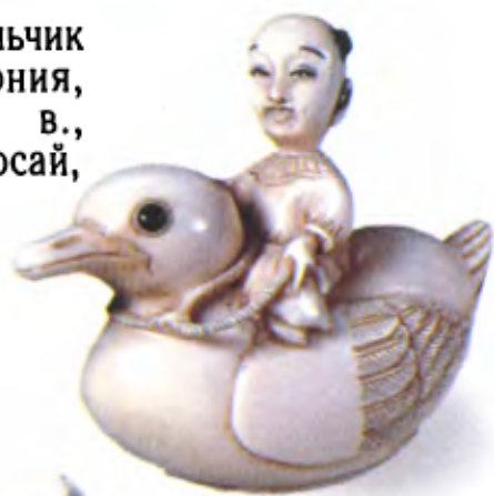
Китайский мальчик на утке. Япония, середина 19 в., мастер Гиоккосай, резная кость