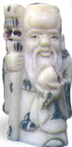
Шоусин с посохом. Китай, 18 в., резная кость