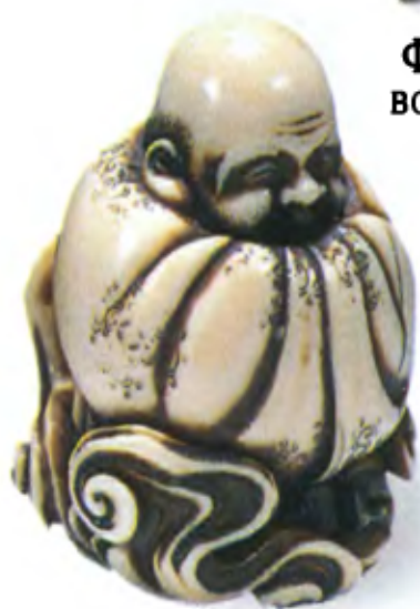
Фукурокудзю на облаке. Япония, середина 19 в., мастер Митсухиро, резная кость