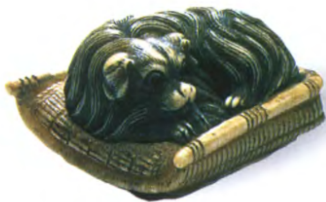
Собачка на лежанке. Япония, конец 18 — начало 19 в., бивень нарвала

Чаще всего мастера нэцкэ изображали в своем творчестве именно таких четвероногих друзей, которые продолжали верно служить своим хозяевам и в виде поясных брелоков.