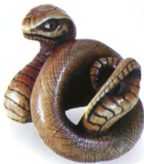
Змея. Япония, 19 в., мастер Иккосай, резная кость