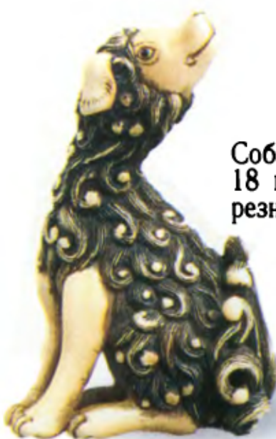
Собака. Япония, 18 в., мастер Гечу, резная кость