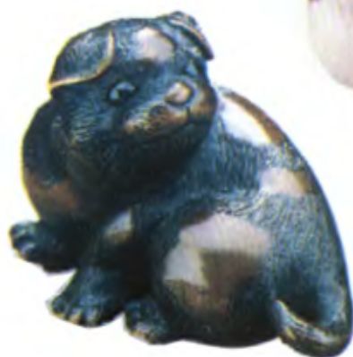
Собачка. Япония, первая половина 19 в., мастер Тоимаса, резное дерево с инкрустацией