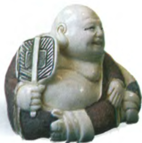
Хотей с веером. Япония, 20 в., резная кость