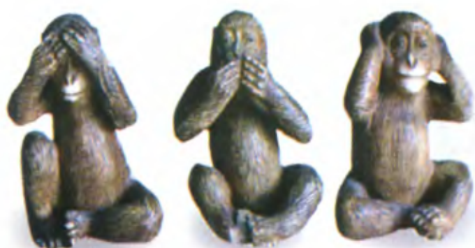
Три обезьяны. Япония, 19 в., резная кость

Любопытно, что по-японски фраза «ничего не вижу, ничего не слышу, ничего не говорю» звучит как «мизару, киказару, ивазару». Японское слово же «обезьяна» звучит сходно с окончанием каждого из этих трех глаголов — «зару» или «дзару». Поэтому изображение обезьян, иллюстрирующих буддийскую идею неприятия зла, является в японской иконографии следствием своеобразной игры слов. Эту тему мастера нэцкэ часто отражали в своих произведениях.