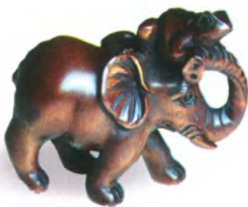
Слон с лягушкой. Япония, 19 в., резное дерево

В Китае слон олицетворяет силу и верховную власть. Он является символом осмотрительности, проницательности и долголетия. Неподалеку от Пекина находятся могилы императоров династии Мин. По обе стороны ведущей к ним дороги стоят огромные каменные фигуры слонов. До сих пор многие бездетные китайянки верят: если положить камень на спину одного из этих изваяний, это способствует избавлению от бесплодия.