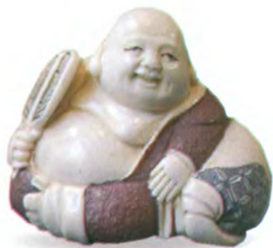
Будда с веером. Япония, 20 в., резная кость

Будда умер в 544 г. до н. э., когда ему было 80 лет. Дата его кончины в день майского полнолуния совпала с датой рождения. Тело было сожжено. Сиддхартха не записывал проповеди. Спустя триста лет устной передачи учения оно было записано на пальмовых листьях, которые составили три книги, известные как Трипитака.