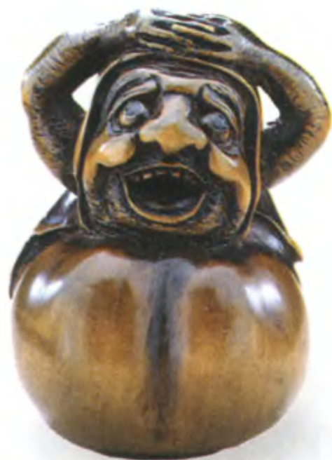
Дарума. Япония, конец 18 — начало 19 в., мастер Иссан, дерево с инкрустацией