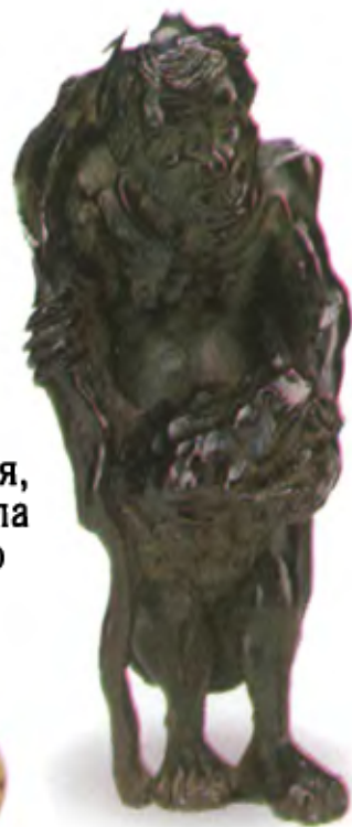
Гама-сэннин. Япония, конец 18 в., школа Мива, резное дерево