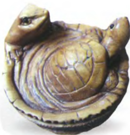
Черепаха в кадке и лягушка. Япония, 19 в., резное дерево