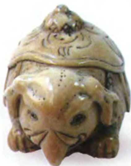
Слон. Япония, 19 в., мастер неизвестен, резная кость