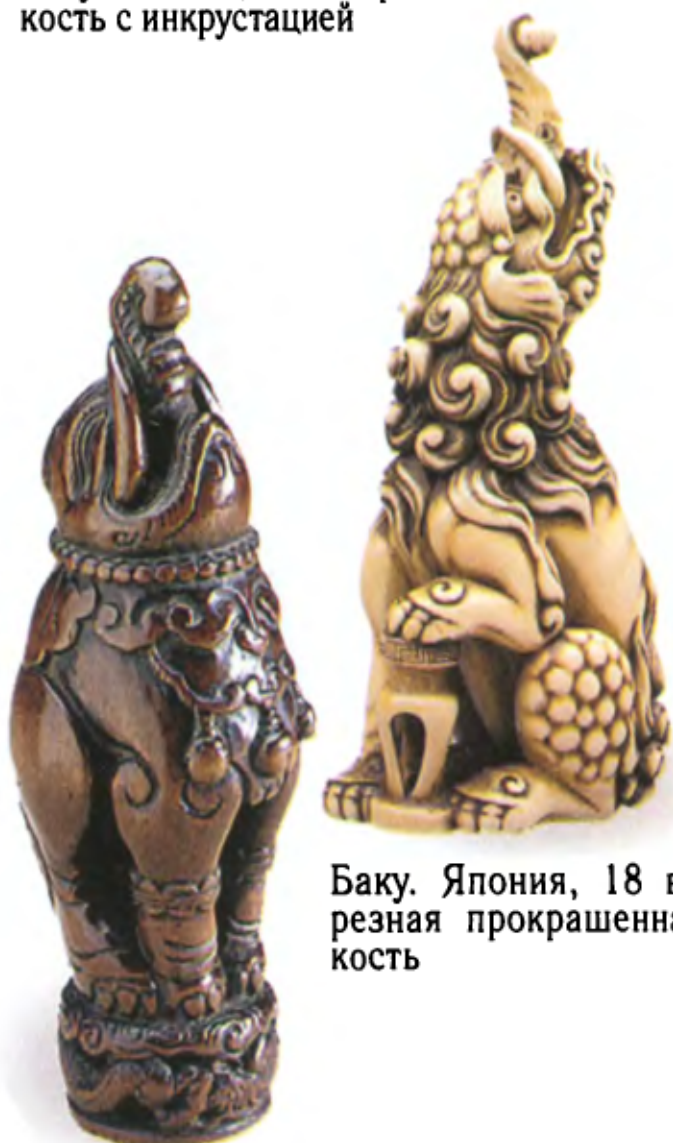
Баку. Япония, 18 в., резная прокрашенная кость