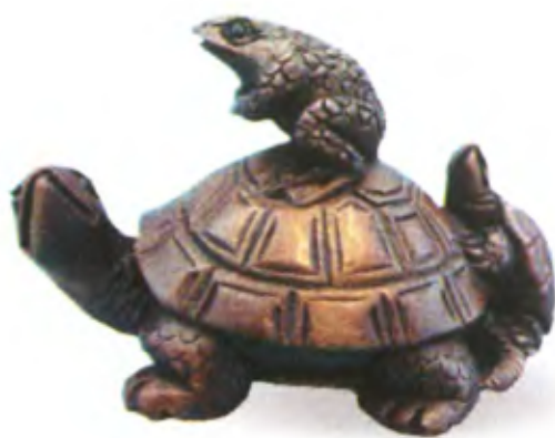
Жаба на черепахе с черепашонком. Япония, 19 в.

Представления о мистических свойствах черепах проникли и в японскую культуру. Японцы верили, что черепаха способна прожить тысячу лет, постепенно накапливая знания об окружающем мире. Она может дать бесценный совет. При этом своеобразным символом долголетия черепахи считался ее удлиненный «хвост», образованный волочащимися за панцирем водорослями. Японцы называют таких черепах миногаме — (mino-game или minogame). Мастера нэцкэ иногда изображали на панцире черепахи трех жаб, и эти ее спутники усиливали благоприятное значение символа. Частыми спутниками Фуцурокудзю, одного из семи богов счастья, в японской мифологии являются журавль, олень и черепаха. Изображение черепахи с детенышами на панцире символизирует в Японии материнство; считается, что оно приносит достаток и любовь в семью.