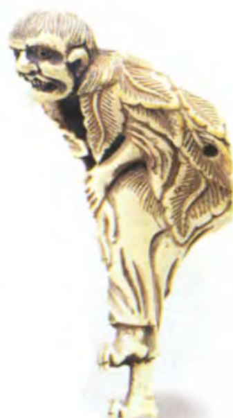
Даос, стоящий на одной ноге. Япония, конец 18 — начало 19 в., резная кость