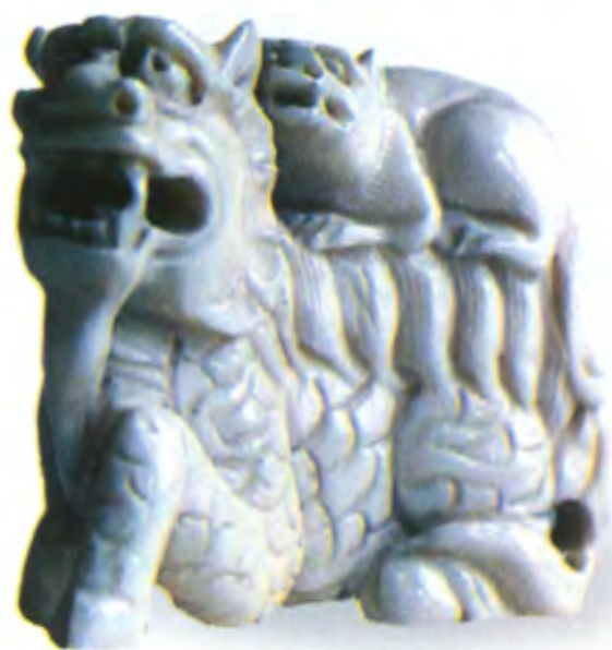
Дракон с детенышем. Япония, 19 в., мастер Гиокусеки, резная кость