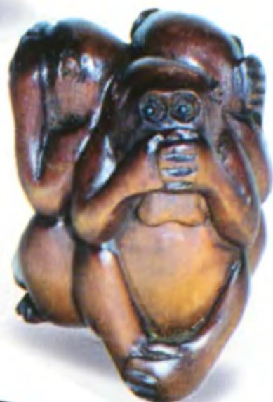
Три обезьяны, прижавшиеся спинами. Япония, 19 в., резное дерево