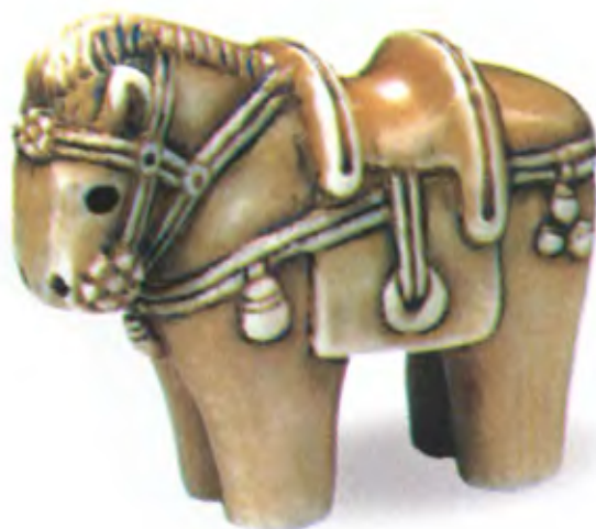
Лошадка-ханива. Япония, конец 19 — начало 20 в., мастер Тошитсугу, резная кость