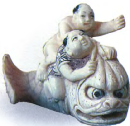
Рыбаки на гигантской рыбе. Япония, между 1770 и 1843 гг., резная кость