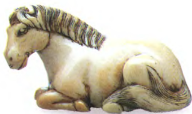
Лошадь. Япония, 18 в., резная кость

Резчики нэцкэ нередко изображали лошадей. Традиционным считалось изображать пасущуюся лошадь, которая низко склонила голову к земле. Часто ее копыта были сведены вместе. Такая фигурка нередко служила наверхшием для печати, которая вырезалась в основании фигурки.