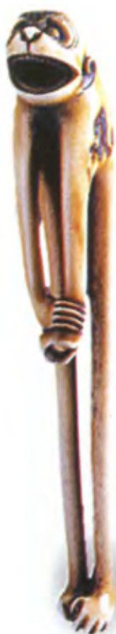
Обезьяна. Япония, середина 19 в., мастер Кокусай, резная кость

На стенах конюшен и в Китае, и в Японии было принято изображать обезьян. Считалось, что такие изображения уберегают лошадей от болезней. Именно поэтому стены конюшни знаменитого японского храма Тосёгу украшены резными фигурками обезьян.