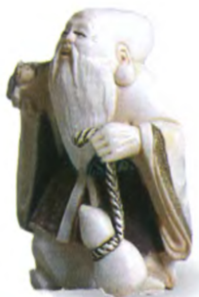
Фукурокудзю с тыквой-горлянкой. Япония, начало 20 в., резная кость