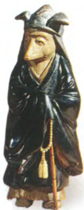
Лиса, обернувшаяся монахом. Япония, 19 в., мастер Кококу, резное дерево