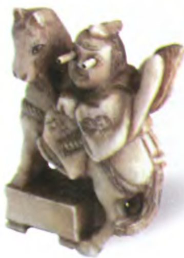
Всадник на лошади. Нэцкэ с трюком. Япония, 19 в., мастер Гуокуичи, резная кость