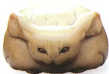
Кролик в форме луны. Япония, 18 в., резная кость с инкрустацией