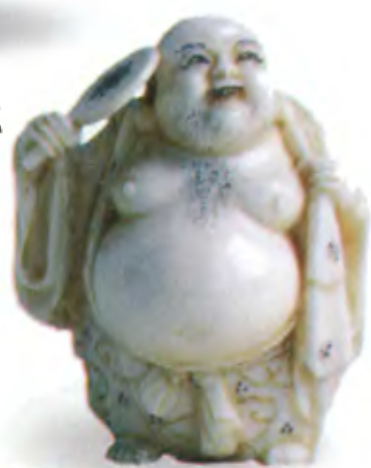
Будда с веером. Япония, мастер Шофо, между 1868 и 1911 гг., резная кость