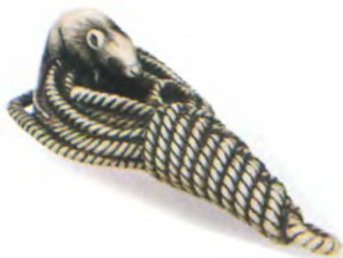
Крыса на сложенной веревке. Япония, середина 19 в., резная кость