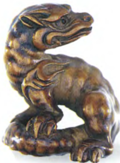
Детеныш дракона. Япония, конец 18 — начало 19 в., мастер Томакацу, резное дерево