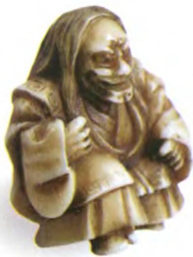
Актер театра Но в маске Шаккио. Япония, 19 в., резная кость, мастер Шугецу

Среди масок театра Но встречаются маски детей, старух, цветущих женщин, злых и добрых духов. Их пластика столь выразительна, что мастера нэцкэ не могли пройти мимо столь вдохновляющих сюжетов. Особенно любопытны нэцкэ с вращающейся деталью, которая изображает лицо актера и одновременно его маску. Когда такую деталь поворачивают, создается впечатление, что актер надевает маску.