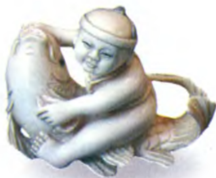
Бенкей на рыбе. Япония, между 1801 и 1867 гг., мастер Шозан, резная кость

Некоторые нэцкэ изображают людей на спине мифического сома. Такая аллегория может говорить об опасных и самонадеянных попытках обуздать грозные силы природы, которые неизбежно пошлют кару на головы ослушников.