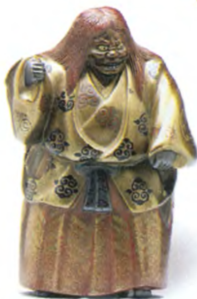
Актер театра Но в роли Шишигучи. Япония, 19 в., позолота, лакировка