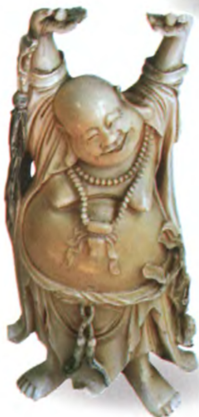
Смеющийся Будда. Япония, конец 19—начало 20 в., резная кость