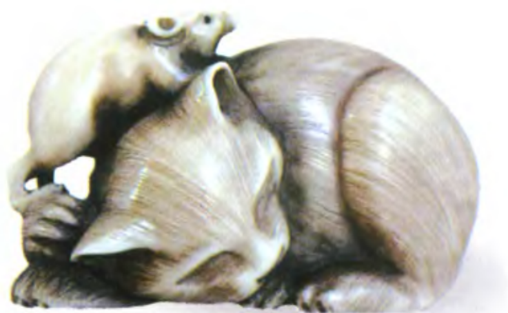
Кот и крыса. Япония, 19 в., мастер Хироаки, резное дерево

Наряду с лисами и енотами, кошки в Японии считались животными-оборотнями. В отличие от своих мифических собратьев кицунэ и тануки, кошки-оборотни часто помогают людям. Старинная японская легенда рассказывает о кошке, которая жила в заброшенном храме. Вскоре она стала выходить на ближайшую дорогу, садиться на задние лапы и поднимать лапку, как бы в знак приветствия. Вскоре люди, узнав о столь необычной кошке, потянулись к храму, чтобы посмотреть своими глазами на это диво. Так храм вернул себе утраченную популярность. С тех пор в Японии фигурка кошки с поднятой передней лапой считается талисманом, способным приманить счастье, удачу и клиентов.