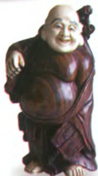
Будда с веером. Япония, середина 20 в., дерево, резная кость