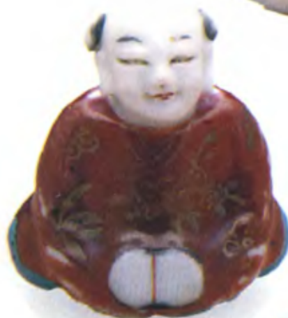
Китайский мальчик. Япония, 19 в., фарфор, золочение