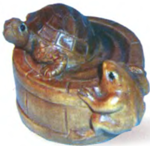
Черепаха в кадке и лягушка. Япония, 19 в., резное дерево