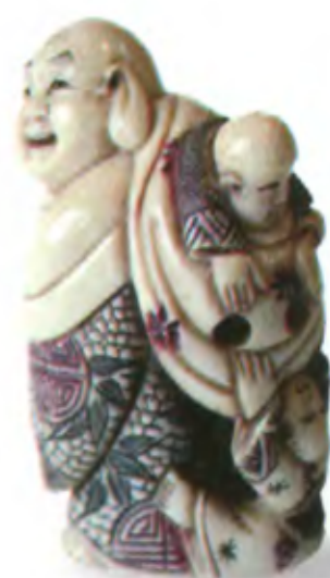
Будда с двумя детьми. Япония, конец 19 в., мастер Конобу, резная кость