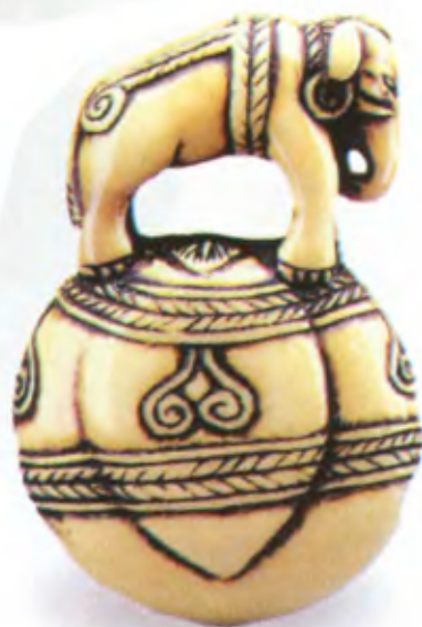
Пряжка с фигуркой слона. Япония, 18 в., резная окрашенная кость