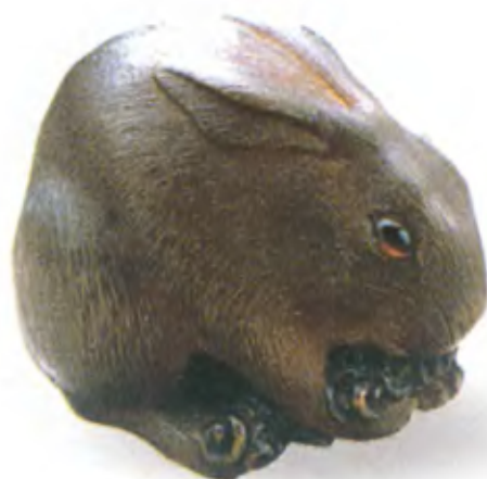
Кролик. Япония, начало 19 в., мастер Томокацу, резное дерево с инкрустацией