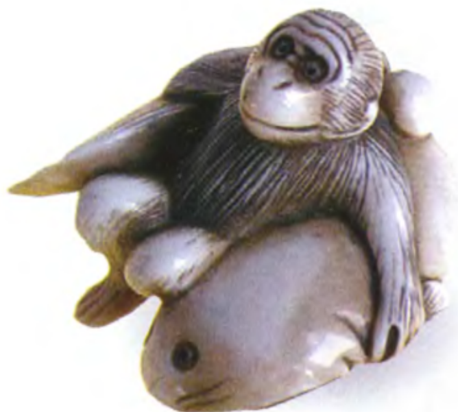
Обезьяна с сомом Намадзу. Япония, 18 в., резная кость