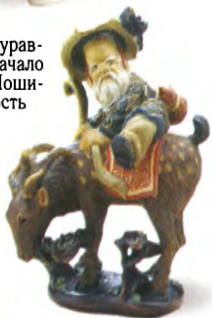
Окимоно «Дзюродзин на олене». Япония, конец 19 в., мастер Кейсукэ, окрашенное дерево