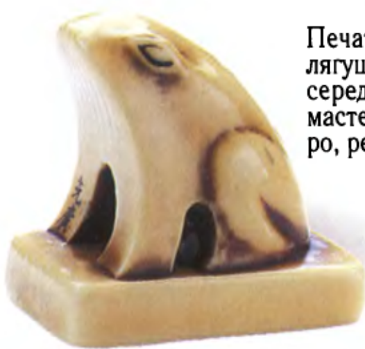
Печать в форме лягушки. Япония, середина 19 в., мастер Митсухи-ро, резная кость