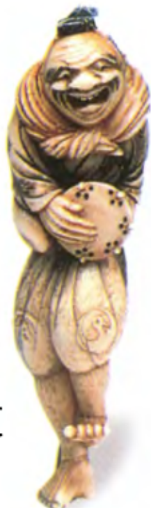
Комический актер Манзай. Япония, середина 19 в., резная кость