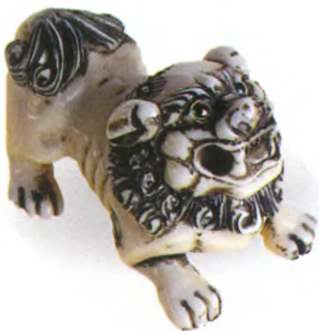
Шиши. Япония, конец 19 в., мастер Шозан, резная кость с инкрустацией.

Если пасть карасиси открыта, это означает, что он пытается своим оскалом испугать злых демонов. Закрытая пасть символизирует защиту или удерживание добрых духов. К тому же первая буква санскрита — «Аh» — символизирует открытый рот, а последняя — «Un» — закрытый рот. Комбинация же этих крайних букв говорит о рождении и смерти. Часто лев карасиси удерживает лапой шар Тама, который в буддизме является символом мудрости, приносящим свет во тьму бытия. Этот шар также содержит в себе энергию, которая необходима для великих свершений. Любопытно, что в Японии существовал обычай наносить изображение карасиси на живот женщин, ожидающих потомства. Возможно, поэтому до сих пор фигурки и нэцкэ карасиси считаются оберегами, способными защитить ребенка от злых сил.