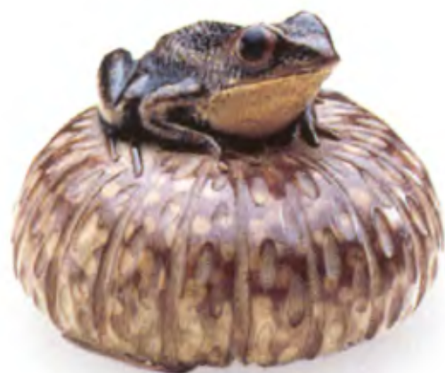
Лягушка на тыкве. Япония, середина 19 в., мастер Номубаса, резное дерево