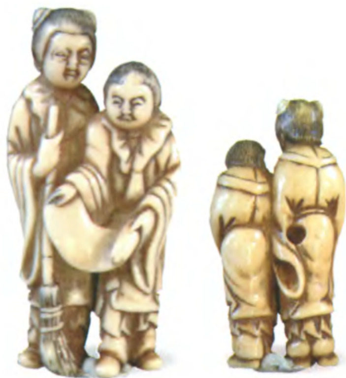
Кандзан и Дзиттоку. Япония, конец 19 в., автор неизвестен, резная кость