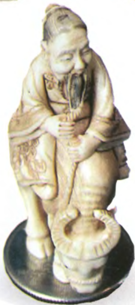
Лао Цзы на волé. Япония, период Эдо (1801–1867), резная кость