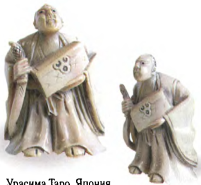
Урасима Таро. Япония, 19 в., резная кость

Сюжет этой сказки был весьма популярен, и резчики нэцкэ нередко изображали Урасиму в своих работах.