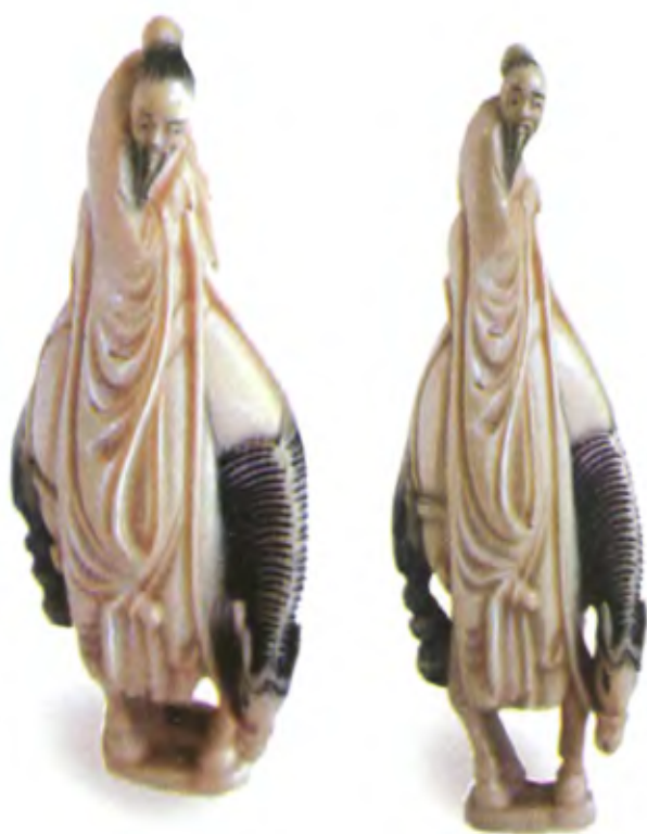
Лао Цзы на лошади. Япония, 19 в., мастер Гиокушин, резная кость

Образ Лао Цзы проник и в культуру Японии. Мастера нэцкэ часто изображали его восседающим верхом на быке или на волé.