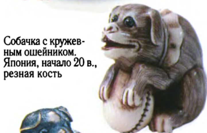
Собачка с кружевным ошейником. Япония, начало 20 в., резная кость