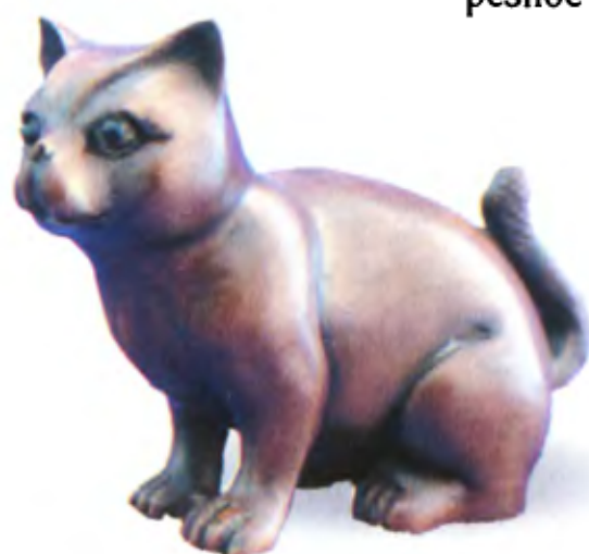
Кот. Япония, 19 в., резное дерево