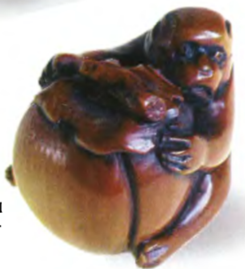
Обезьяна, обнимающая персик. Япония, 19 в., резное дерево