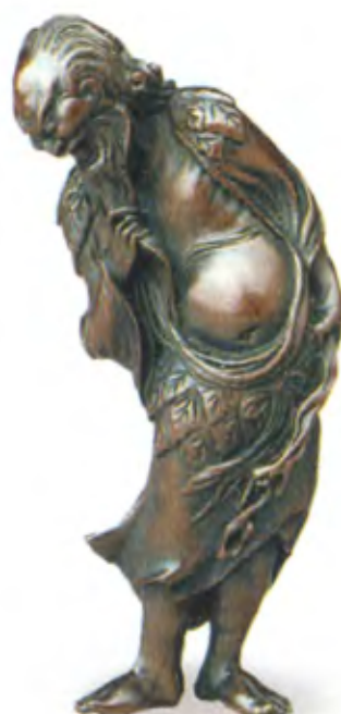
Даос. Япония, середина 19 в., мастер Риомин, резное дерево