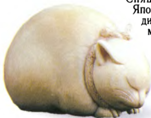
Спящий кот. Япония, середина 19 в., мастер Масатсугу, резная кость