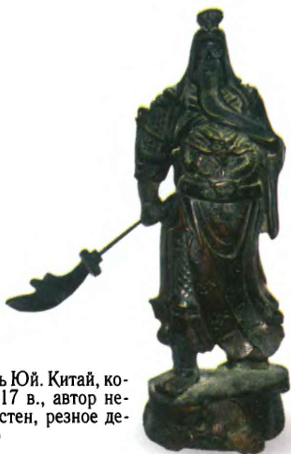
Гуань Юй. Китай, конец 17 в., автор неизвестен, резное дерево