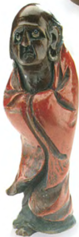
Дарума. Япония, конец 19 — начало 20 в., мастер Яматошимачи, дерево с инкрустацией