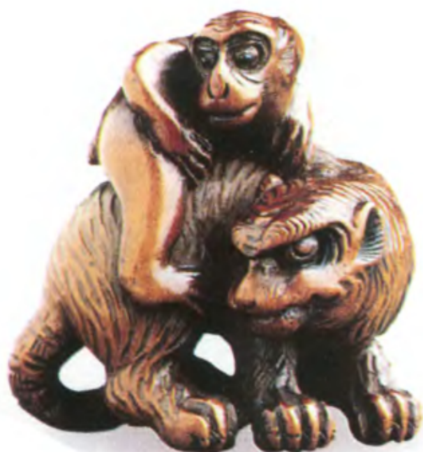
Тигр с обезьяной. Япония, 18 в., резное дерево с инкрустацией