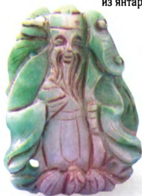
Шоусин. Китай, 19 в., резьба по камню