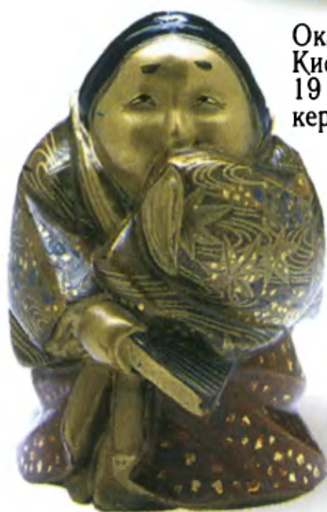
Окамэ. Япония, Киото, середина 19 в., поливная керамика, глазурь