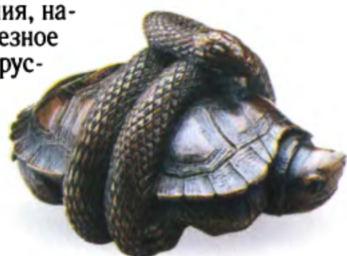
Змея, обвившая черепаха. Япония, начало 19 в., резное дерево с инкрустацией