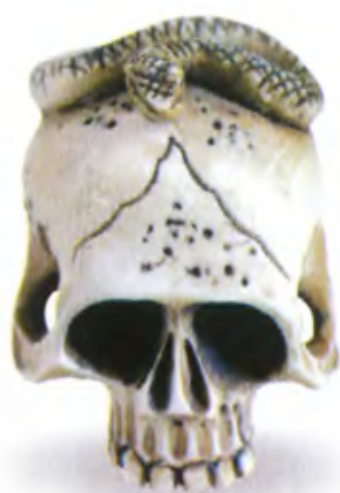
Змея на черепае. Япония, 19 в., мастер Садакацу, резная кость

Мастерам нэцкэ было известно о мистических толкованиях образов змей, не случайно их порой изображали свернувшимися на черепае — универсальном символе смерти. Однако чаще встречаются нэцкэ, просто демонстрирующие змей в их различных естественных позах.