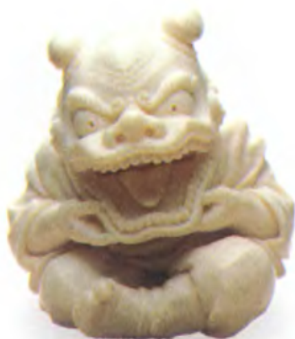
Мальчик, надевший маску Шиши. Япония, конец 19 в., мастер Комей, резная кость