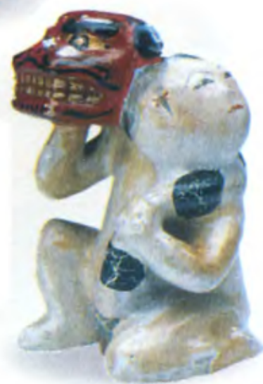
Мальчик с маской тигра. Япония, 20 в., резное дерево