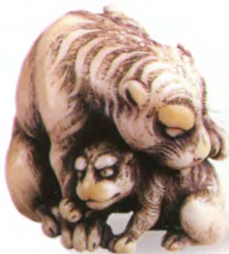
Тигр с тигренком. Япония, 18 в., мастер Томотада, резная кость