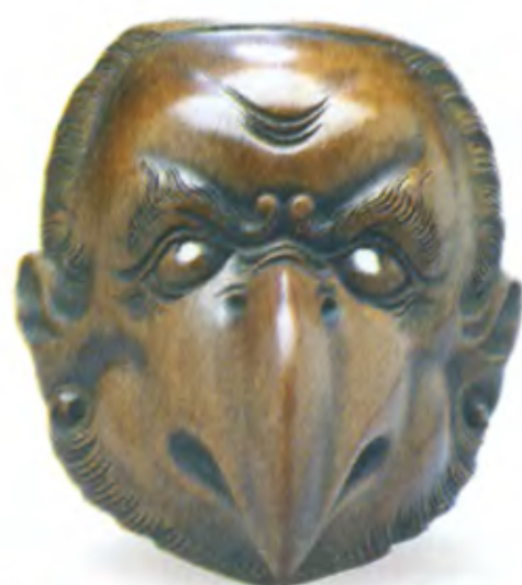
Маска Тэнгу. Япония, середина 19 в., мастер Риумин, резное дерево