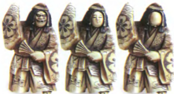
Актер театра Но. Япония, начало 19 в., резная кость, мастер Масатсугу. Фигурка с поворачивающейся деталью — лицом