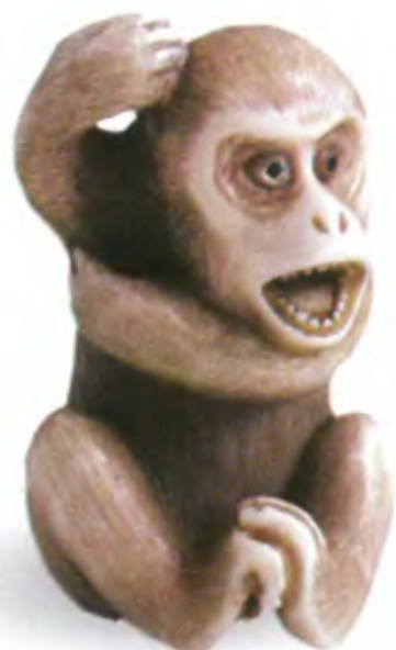
Обезьяна, которая чешет под мышкой. Япония, 19 в., мастер Масачика, резная кость