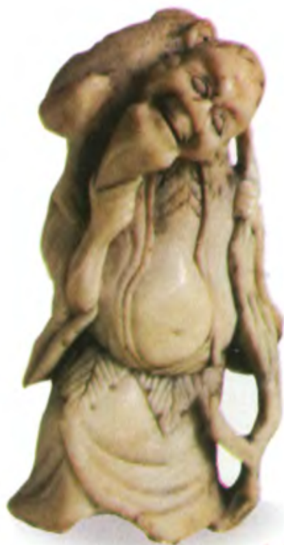
Гама-сэннин. Япония, 18 в., автор неизвестен, резная кость