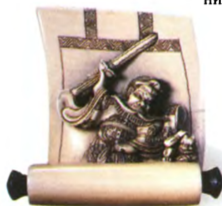
Шоки, появляющийся из свитка. Япония, середина 19 в., мастер Хидемаса, резная кость