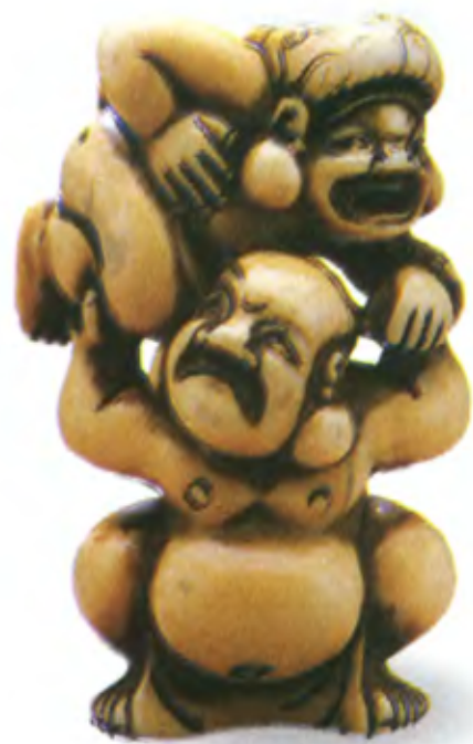
Дайкоку и Эбису. Япония, 18 в., резная кость

Дайкоку часто изображают вместе с божеством Эбису. По одной версии это отец и сын. В Японии статуи Дайкоку часто можно увидеть перед храмами. Японцы верят: если потереть ладони этого божества, это принесет счастье и удачу.