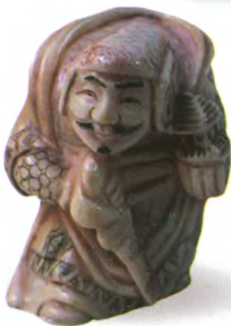
Бисямонтен. Япония, конец 19 в., автор неизвестен, резная кость