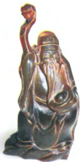
Шоусин с персиком. Япония, 19 в., резное дерево