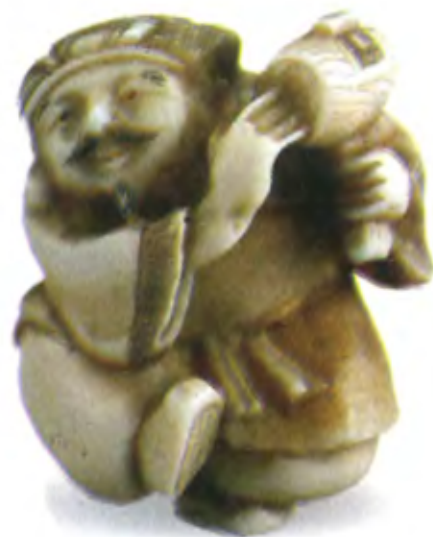
Пляшущий Дайкоку. Япония, начало 20 в., резная кость