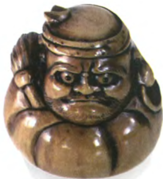
Дарума. Япония, 19 в., мастер Митсухиро, резная кость

Знаменитый исторический персонаж продолжил свою жизнь в фольклоре. В Японии принято под Новый год дарить похожих на матрешки безглазых кукол дарума. Загадав желание, следует нарисовать даруме один глаз и поставить ее на видное место. Вторым глазом кукле дорисовывают, только когда цель достигнута. Таким образом, одноглазая дарума не позволяет забыть о необходимости движения к цели.