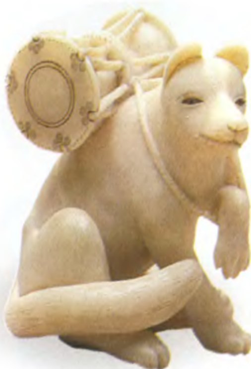
Лиса с барабаном. Япония, 19 в., мастер Масатсугу, резная кость