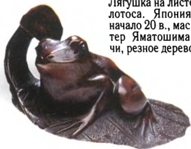
Лягушка на листе лотоса. Япония, начало 20 в., мастер Яматошима-чи, резное дерево

В Древнем Китае жабу считали зловредным созданием, существовала особая «жабья магия». Затем в народе получила распространение легенда о Будде, который покорила жабу своей волшебной силой и обязал помогать людям. С тех пор жаба стала считаться частой спутницей мудрецов и лекарей. Мифы говорят, что после встречи с Буддой жаба стала расплачиваться с людьми за причиненные им ранее неприятности, выплевывая изо рта золотые монеты. Благодаря этому поверью в Китае изображение трехпалой жабы, держащей во рту монетку, стало символом богатства и удачи. Японцы переняли эту символику. Жаба с детенышем символизирует у них также материнство. Она приносит в семью благополучие и процветание. Две жабы, изображенные вместе, говорят о духовном и материальном богатстве, которые вытекают одно из другого. Следует добавить, что изображение лягушки у японцев связано со странствиями и путешествиями. Японское слово «лягушка» — каэру — является омонимом глагола «возвращаться». Поэтому изображение лягушки часто используется как омамори — оберег. Он помогает путешественникам переносить тяготы пути и благополучно вернуться домой.