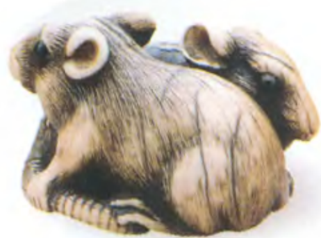
Пара крыс. Япония, 18 в., резная кость