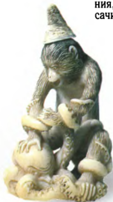
Обезьяна с осьминогом. Япония, конец 19 — начало 20 в., мастер Минкоку, резное дерево