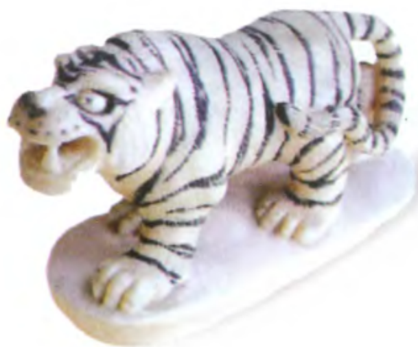
Крадущийся тигр. Япония, начало 20 в., мастер Хикураку, резная кость

В традиции нэцкэ изображения тигра были связаны главным образом с положительными чертами этого образа. Фигурку тигра можно было рассматривать как своеобразный амулет, защищающий владельца от злых сил и болезней.