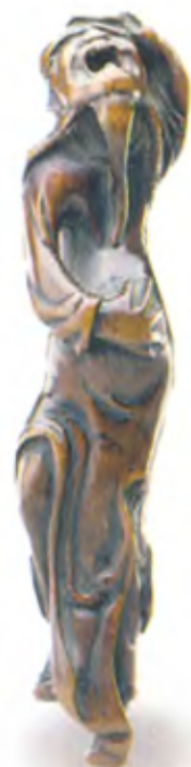
Даосский монах. Япония, 18 в., резное дерево