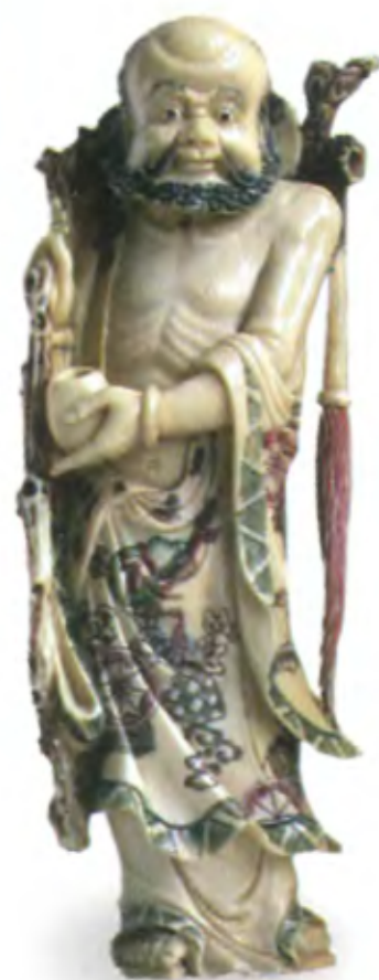
Дарума. Япония, начало 20 в., резная подкрашенная кость