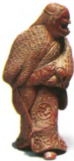
Актер театра Но в роли Ханья. Япония, конец 19 в.