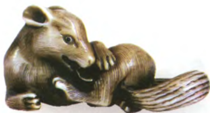
Вылизывающаяся лиса. Япония 19 в., резная кость

Старинная легенда рассказывает также, что некогда недалеко от Киото жила пара серебристых лис со своим потомством. Однажды это лисье семейство отправилось в храм Фушими, где предложило свои услуги богу Инари, который заботился об урожаях. С тех пор серебристый лис стал посланцем бога Инари. В подтверждение этой легенды возле храма Фушими-Инари японцы поставили множество фигурок лисиц.