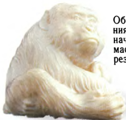
Обезьяна. Япония, конец 19 — начало 20 в., мастер Комей, резная кость