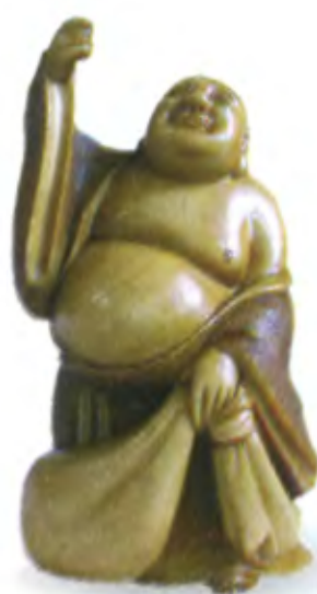
Хотей с поднятой рукой. Япония, 19 в., резная кость