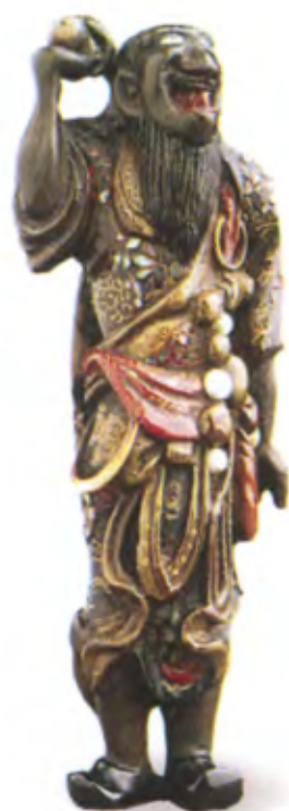
Даос с сакральным драгоценным камнем. Япония, 18 в., дерево, инкрустация