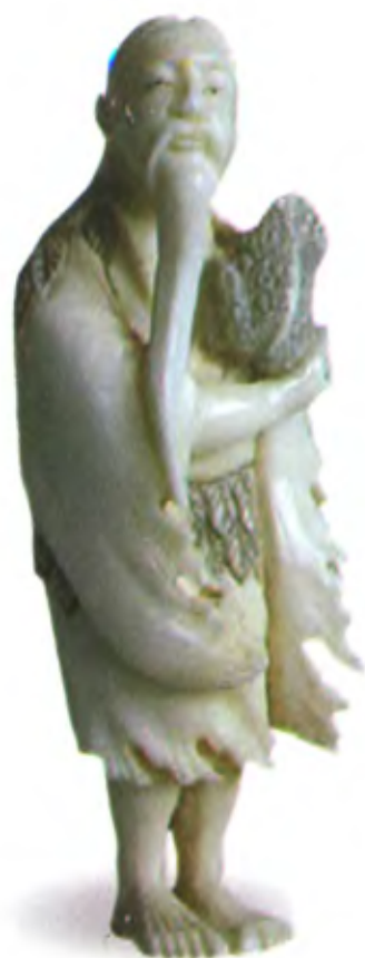
Гама-сэннин. Япония, 19 в., мастер Шушин, резная кость

Поскольку в японской мифологии жаба является символом богатства, позже бескорыстный врачеватель Гама-сэннин стал восприниматься как божество, дарующее не только здоровье и долголетие, но и материальные блага.