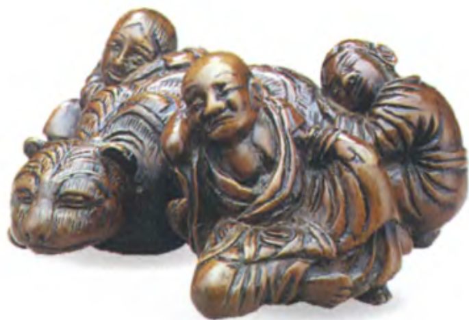
Спящие Кандзан, Дзиттоку, Букан и тигр. Япония, 18 в., резное дерево