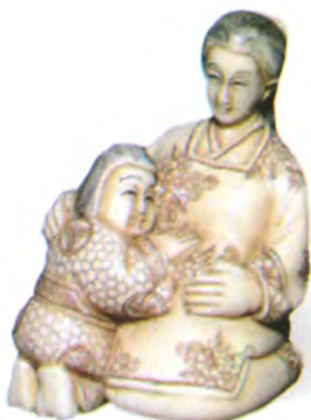
Женщина с ребенком. Япония, конец 19 в., резная кость

Изображали Цзинь-гу весьма своеобразно.левой рукой она придерживает ребенка, а в правой держит ветку коричневого дерева. В правой руке ребенка губная гармошка, а в левой — цветок лотоса. При этом слова «ребенок» — по-китайски «цзы», «корица» — «гуй», «гармошка» — «шэн» и «лотос» — «лянь» звучат как фраза, которую можно перевести как «непрерывно рождают знатных сыновей». В буддийских храмах Китая статую Цзинь-гу нередко окружают ее ближайшие помощницы — Пэйтэй няннан («матушка, содействующая зачатию») и Инмэн няннан («матушка, приносящая детей»).