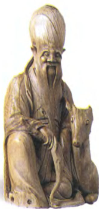
Шоусин с оленем. Китай, 17 в., резная лакированная кость

В старину культ Шоусина в Китае был чрезвычайно распространен. Его изображения ставили в домашних алтарях или в храмах. Картинками с изображением Шоусина обклеивали стены домов. В честь святого возводили храмы. Образ «бога долголетия» проник и в японскую культуру. Во время празднования дня рождения японцы пекут особые хлебцы в форме персиков. Под Новый год в Японии принято пить персиковый сок. В это время к воротам домов прикрепляют дощечки, которые символизируют молитвы о счастье.