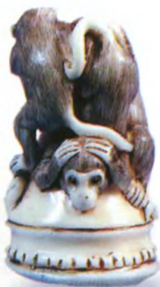
Три обезьяны. Япония, 19 в., резная кость