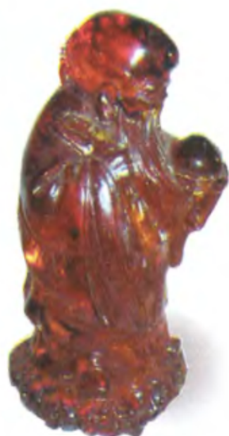
Шоусин. Китай, возможно, 18 в., фигурка из янтаря