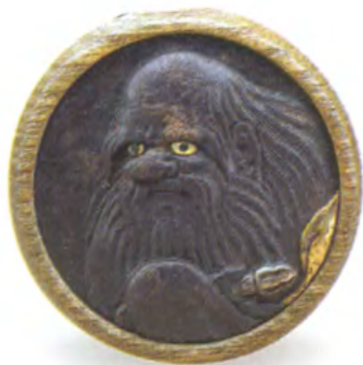
Тэнгу. Япония, середина 19 в., мастер Шураку, металлический диск в деревянной раме