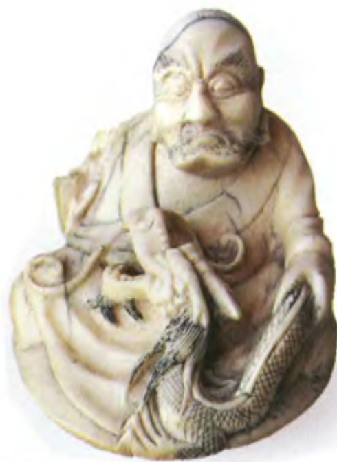
Окимоно Архат Хандака с драконом. Япония, период Мейджи (1868–1911), резная кость