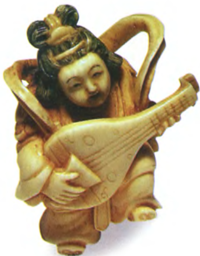
Бэnten Сама. Япония, 19 в., резная окрашенная кость, мастер неизвестен

Имя богини Бэндзайтен стало в Японии нарицательным. Так часто называют красивых женщин. Начиная с периода Камакура (1192—1333) в буддийских и синтоистских храмах Японии стали появляться созданные художниками фигуры прекрасных обнаженных женщин. Чаще всего это были образы именно Бэндзайтен, воплощенные в камне или дереве.