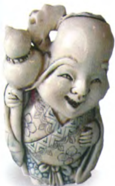
Молодой Фукурокудзю. Япония, между 1781 и 1867 гг., мастер Томотада, резная кость