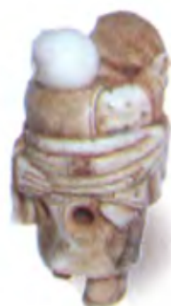
Юань-му с ребенком. Япония, 19 в., резная кость