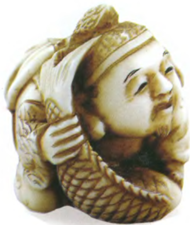
Эбису с рыбой. Япония, 19 в., резная кость