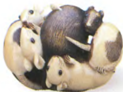
Семь крыс. Япония, середина 19 в., мастер Томошика, резная кость