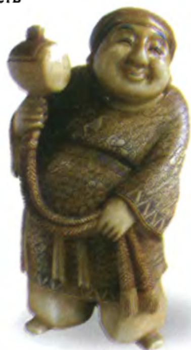
Дайкоку. Япония, 19 в., резная кость