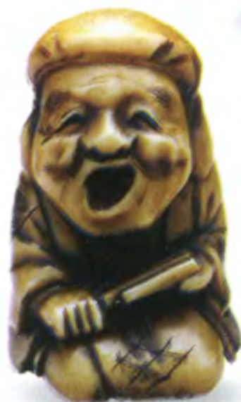
Дайкоку-рассказчик. Япония, 19 в., резная кость