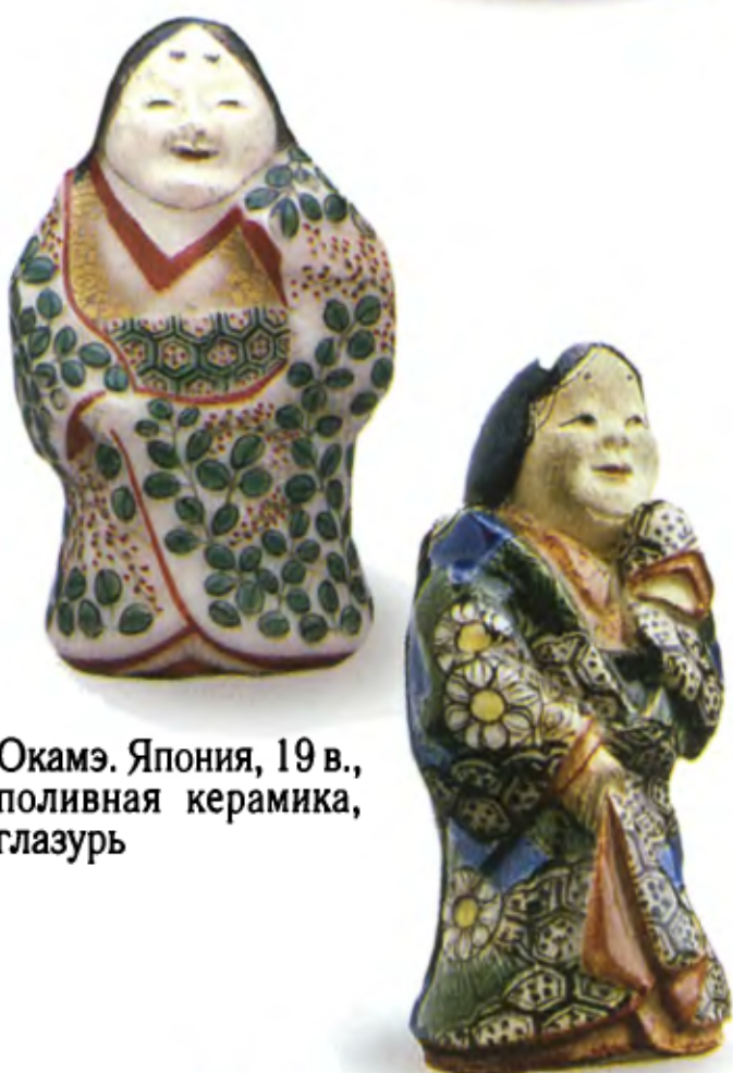
Окамэ. Япония, 19 в., поливная керамика, глазурь