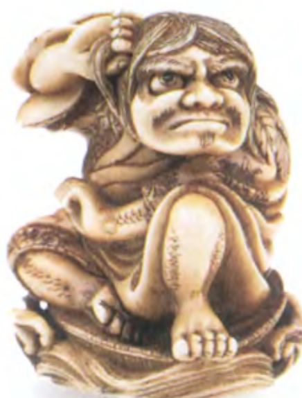
Даосский монах на волнах. Япония, конец 18 — начало 19 в., резная кость