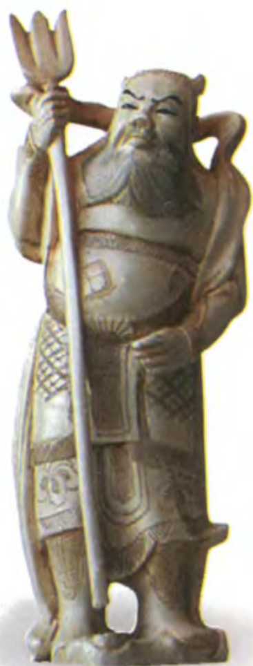
Окимоно Бисямонтен. Япония, период Мейджи (1868–1911), резная слоновая кость