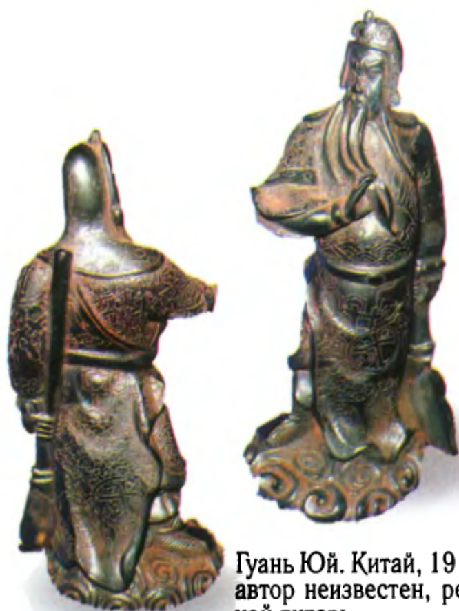
Гуань Юй. Китай, 19 в., автор неизвестен, резной янтарь