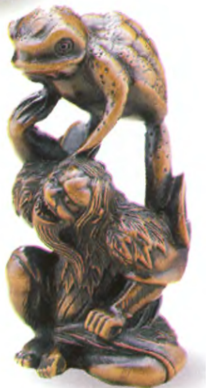
Гама-сэннин. Япония, 18 в., автор неизвестен, резная кость