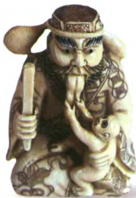
Шоки и демон. Япония, конец 19 в., мастер Та-ро, резная кость

Образ доброго защитника Джанкуя стал чрезвычайно популярным и в Китае, и в Японии. В период Эдо (1600–1868) японцы часто прикрепляли к дверям или перед входом в комнату изображения Джанкуя для того, чтобы оградить помещение от злых духов. Японские мастера нэцкэ, которым Джанкуй был известен как дух целителя Шоки, часто изображали его в компании с маленьким демоном, которого тот собирается поймать.