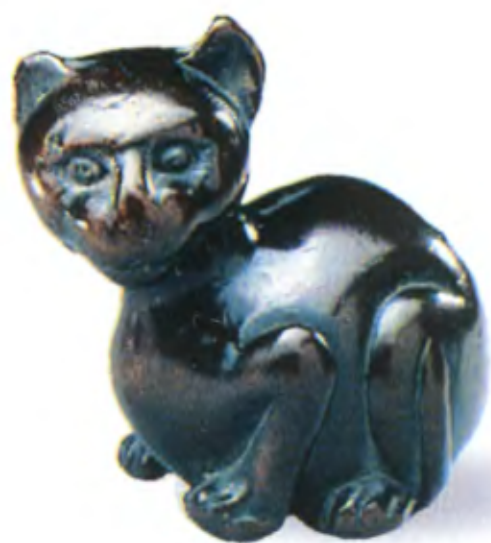
Кот. Япония, 18 в., резное дерево