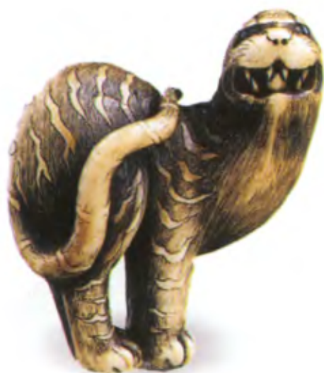
Рычащий тигр. Япония, начало 19 в., мастер Хидемаса, резная кость