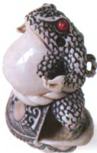
Жаба, изображающая борца. Япония, середина 19 в., мастер Коэтсу, кость с инкрустацией