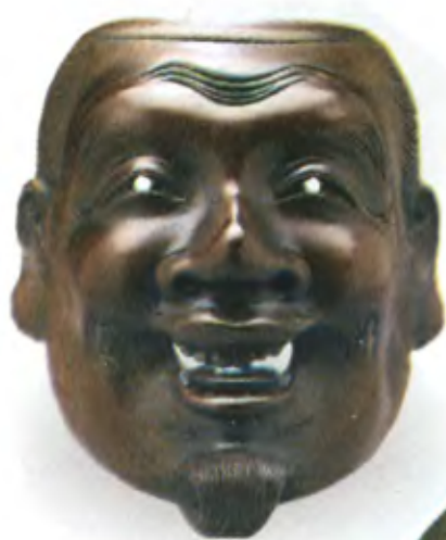
Маска Эбису. Япония, середина 19 в., мастер Риумин, резное дерево

руке и рыбой — в левой. Эбису-рыбак издавна был любимым божеством в Японии и считался одним из семи богов счастья. Рыба, которую он держит в руках, является морским лещом Тай. В конце марта и в начале апреля эти лещи приобретают ярко-красную окраску и идут на нерест к берегам Японии. Поскольку в это время расцветает сакура, морской лещ в брачном наряде считался в Японии королем рыб. Эбису был богом утреннего солнца и покровителем детей. Со временем этот персонаж стал в Японии божеством торговли. Рыба в руках Эбису стала восприниматься как символическая награда за честность в торговых делах. Некоторые нэцкэ изображают, как улыбающийся бородатый Эбису обнимает руками пойманную им рыбу. Такая фигурка ассоциировалась со старинной пословицей, утверждавшей, что «трудно поймать священного карпа голыми руками в чистой воде». Иногда Эбису изображался со сложенным веером, похожим на веер императора, с помощью которого тот принимал или отклонял просьбы подчиненных. Эбису был также покровителем различных ремесел, поэтому резчики нэцкэ порой изображали его мастером определенной профессии — например, ловцом цикад. В паре с Дайкоку Эбису считался покровителем домашнего очага. В настоящее время Эбису олицетворяет процветание и удачу в торговых делах. Двадцатое число каждого месяца считается в Японии днем Эбису, а с 9 по 11 января проводится Тока-Эбису — праздник в его честь.