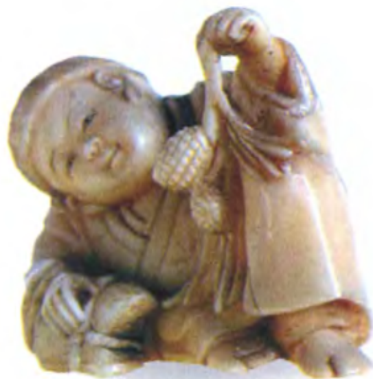
Мальчик с шишками. Япония, начало 19 в., резная кость