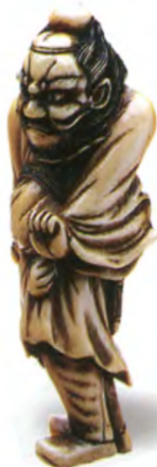
Шоки. Япония, 18 в., резная кость