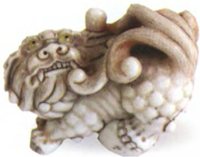
Шиши. Япония, конец 18 в., мастер Томокацу, резная кость