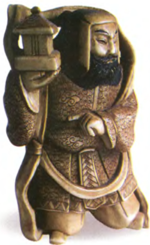
Окимоно Бисямонтен. Япония. 19 в., резная кость

Говорят, что Тамонтемм повелевает демонами Якша и Ракша и обитает на северном склоне горы Шумеру, через которую проходит ось мира.