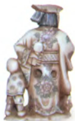
Юань-му с корзиной и ребенком. Япония, 19 в., резная кость