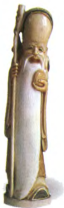
Окимоно Фукурокудзю. Япония, 19 в., мастер Гиокуши, резная кость