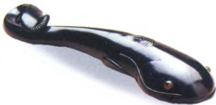
Сом Намадзу. Япония, середина 19 в., янтарь с инкрустацией