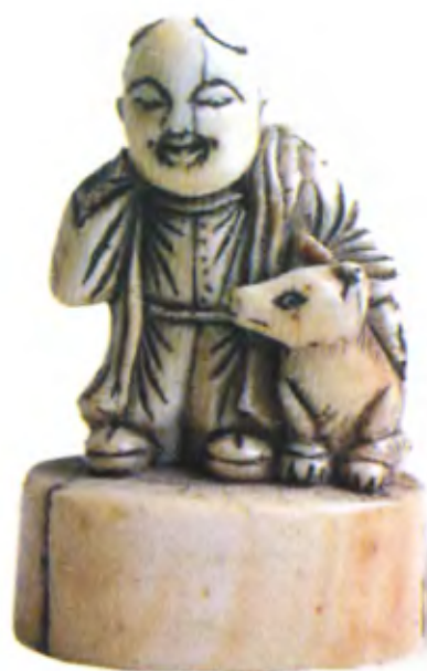
Мальчик с собакой. Япония, конец 18 — начало 19 в., резная кость

Сюжеты нэцкэ, связанные с карако, весьма разнообразны. Иногда ребенка-карако изображали верхом на священном карпе. Нередко такой малыш держит персик — символ бессмертия. Часто ребенок-карако составляет компанию богу счастья Хотею, который является покровителем детей и страждущих. Таким образом, в Японии восприятие карако как символа было шире, чем в Китае. Такая фигурка играла роль универсального талисмана, выражавшего благие пожелания.