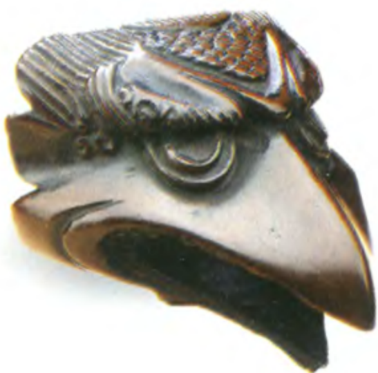
Маска Тэнгу. Япония, конец 18 — начало 19 в., резное дерево

Своими повадками Тэнгу напоминает лешего. Он защищает лес, заставляет плутать путников и пугает лесорубов своим громким хохотом. Горе человеку, который срубил дерево, в котором поселился этот лесной дух. Впрочем, в народных сказаниях Тэнгу обладает и положительными чертами. Он ненавидит тщеславие, гордыню и высокомерие, может ополчиться на сановников, буддийских священников и воинов высокого ранга. Благочестивым же путникам Тэнгу способен оказать покровительство, а праведным воинам дать уроки боевого искусства. Таким образом, в сознании простых японцев Тэнгу постепенно становился олицетворением критики несправедливой власти и защитником простых людей. Японцы считали, что в Тэнгу после смерти может превратиться неисправимый лжец, власть предержащий лицемер или человек, который в течение жизни был преисполнен злобы. Тэнгу способен обратиться в барсука тануки или в лису кицунэ и в таком виде морочить людей.