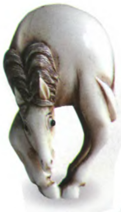
Пасущаяся лошадь. Япония, 19 в., резная кость с инкрустацией