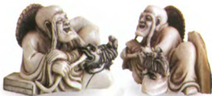
Архат Кала. Япония, начало 20 в., автор неизвестен, резная кость