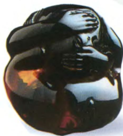
Обезьяна «Три в одной». Япония, середина 19 в., мастер Масатсугу, резной янтарь