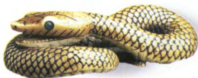
Свернувшаяся змея. Япония, конец 18 — начало 19 в., мастер Раней, резная кость