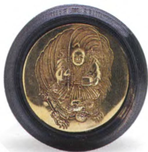
Блюдо с изображением Урасимы Таро. Япония, 19 в., рог буйвола, литье