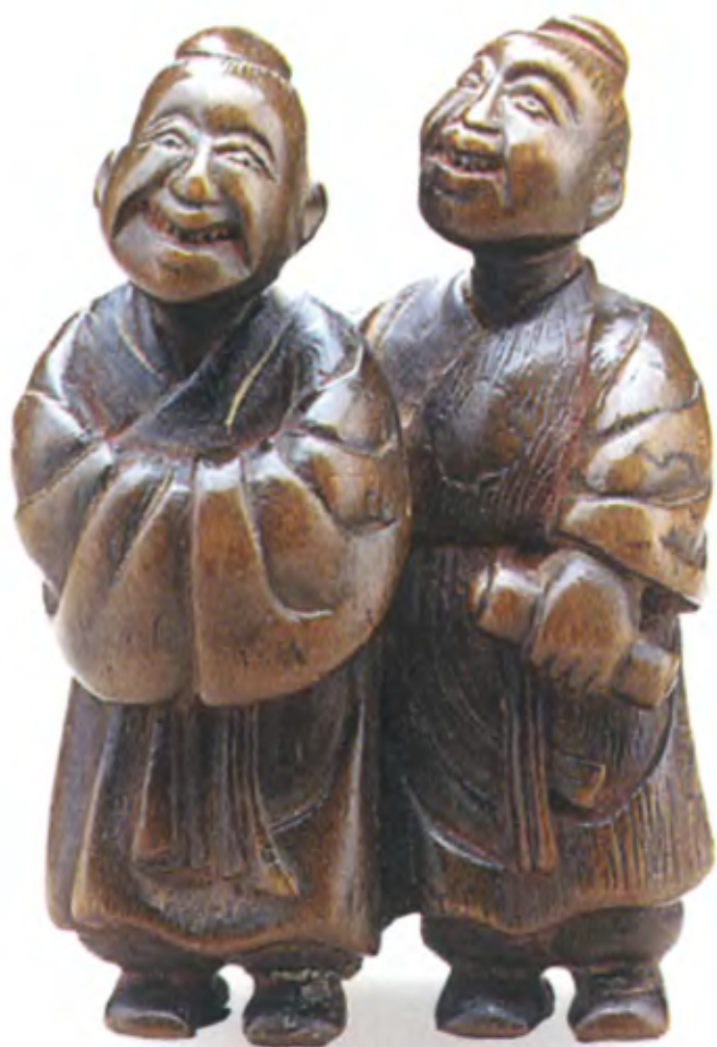
Кандзан и Дзиттоку — дзенские монахи. Япония, конец 18 в., резное дерево

В Японии имена тьянтайских монахов трансформировались почти до неузнаваемости. Их имена стали произноситься как «Кандзан» и «Дзиттоку». Эта пара, конечно же, была известна мастерам-резчикам. При изготовлении нэцкэ первого монаха они обычно изображали с развернутым свитком, а второго — с метлой. Любопытно, что неразлучные монахи часто изображались с распущенными волосами, тогда как буддийские монахи были обязаны брить головы. Возможно, в этой детали отразилась экстравагантность Ханьшань-цзы и Шидэ-цзы, которая часто граничила с юродствованием. Не исключено также, что необычные прически монахов указывают на специфику японской культуры, в которой перемешивались элементы буддизма, синтоизма и даосизма.