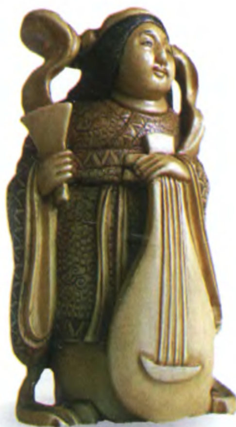
Окимоно Бэnten. Япония, 19 в., резная кость