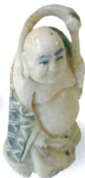
Хотей. Япония, конец 19 в., мастер Матсуда, резная кость