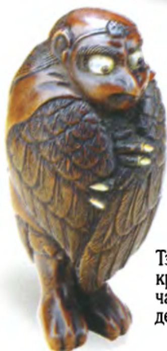
Тэнгу со сложенными крыльями. Япония, начало 19 в., резное дерево с инкрустацией