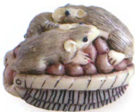
Крысы на блюде с фруктами. Япония, конец 19 в., мастер Масакасу, резная кость

Японцы были знакомы с этой сказкой и не без оснований считали крыс животными умными и сообразительными. В японской мифологии крыса, с одной стороны, символизирует богатство и достаток. Не случайно в нэцкэ крысу часто изображают сидящей на мешке божества богатства и домашнего очага Дайкоку. С другой стороны, в японской мифологии рассказывается о мерзких крысах-духах недзуми, которые могут оборачиваться людьми. В человеческом облике они сохраняют острый нюх и зрение. Такие оборотни часто становятся шпионами и убийцами.