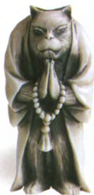
Лиса-монах с четками. Япония, начало 19 в., мастер Йошитсугу, резная кость