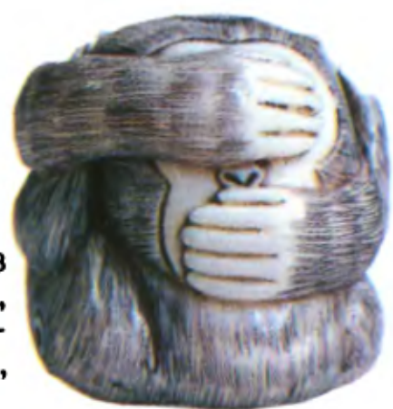
Обезьяна «Три в одной». Япония, начало 20 в., мастер Никагава, резная кость