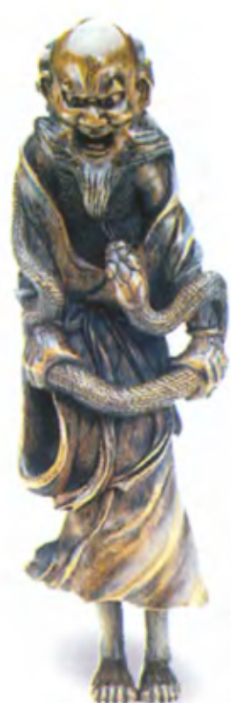
Сэннин со змеей. Япония, 19 в., резное дерево