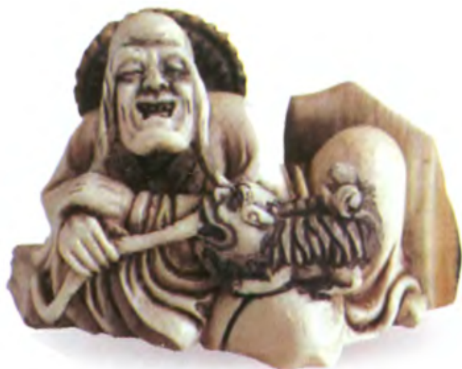
Архат Кала. Япония, начало 20 в., автор неизвестен, резная кость

Резчикам нэцкэ было хорошо известно представление об архатах. Образы этих святых подвижников они нередко использовали в своем творчестве.