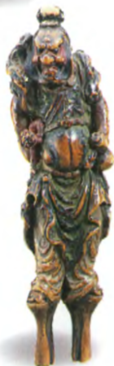
Шоки. Япония, конец 18 в., резное дерево