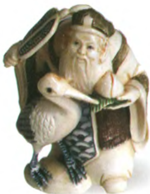
Дзюродзин с журавлем. Япония, начало 20 в., мастер Йошитомо, резная кость

Дзюродзин как раз и является одним из семи японских богов счастья. Он похож на другое божество этой группы — Фукурокудзю. Дзюродзин изображается в виде седобородого старца, которого часто сопровождают журавль и черепаха, символизирующие долголетие и мудрость. Как и Фукурокудзю, Дзюродзин опирается на священный посох шаку, к которому прикреплен свиток. И все же различия есть, хотя они и не очень велики. Голова Дзюродзина не так вытянута, как у Фукурокудзю. В свитке Дзюродзина хранятся сведения о всех существах, живущих на земле, тайны долголетия и бессмертия. В отличие от целомудренного Фукурокудзю, Дзюродзин не чужд плотским радостям жизни. Он отдает долг хмелящим напиткам и не чурается женщин. Прототипом этого божества считается китайский монах Шоу Лао, живший в эпоху династии Хан (220–206 гг. до н. э.). Дзюродзина и Фукурокудзю настолько схожи, что иногда их считают разными духами, воплощенными в теле одного мудрого старца.