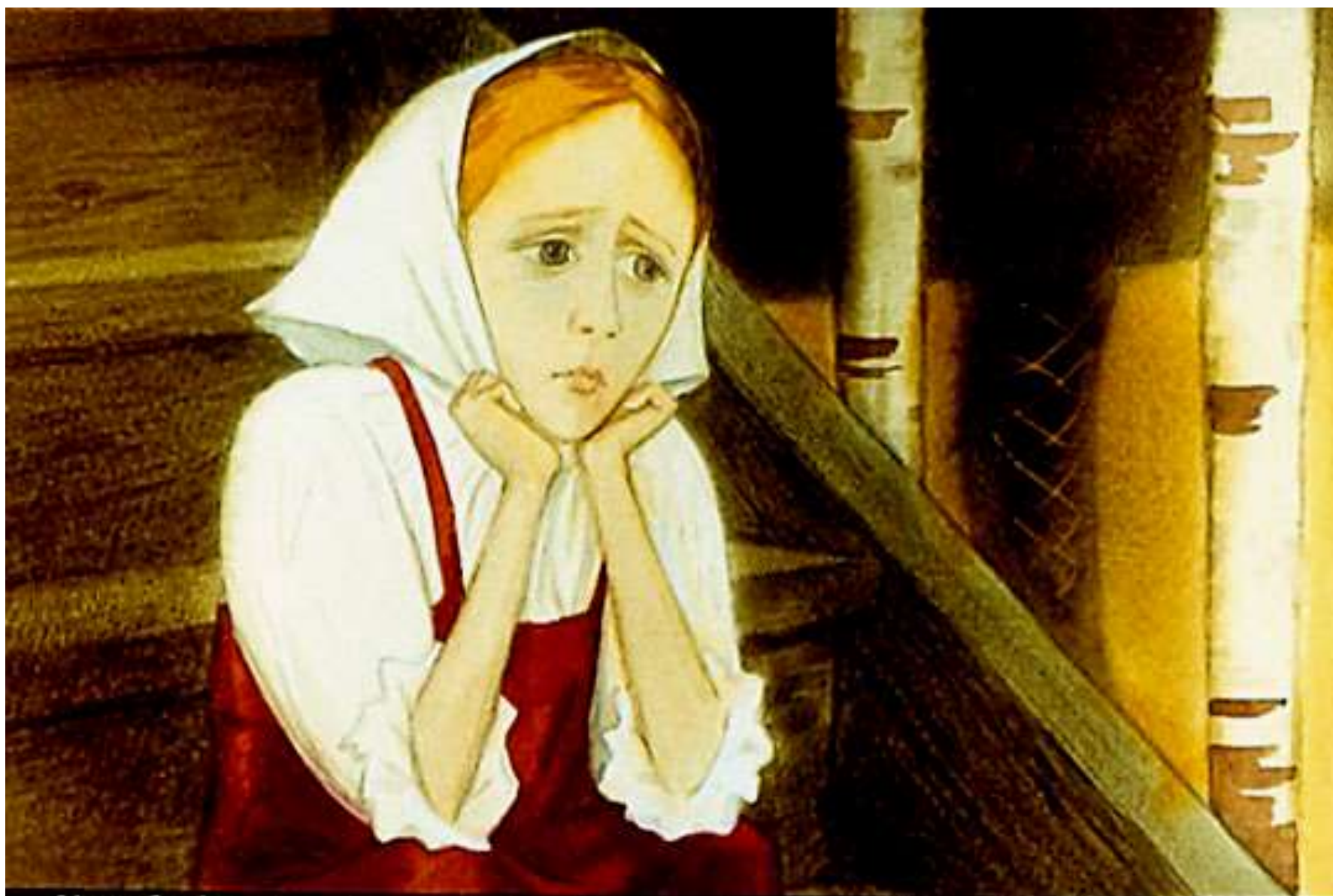
Как баба-яга ушла, Нюрочка-девчурочка вышла на крылечко, села на ступеньку, сидит—горюет.