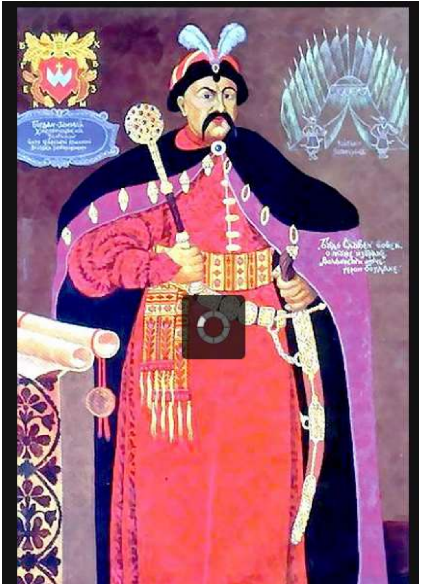
Портрет Богдана Хмельницького