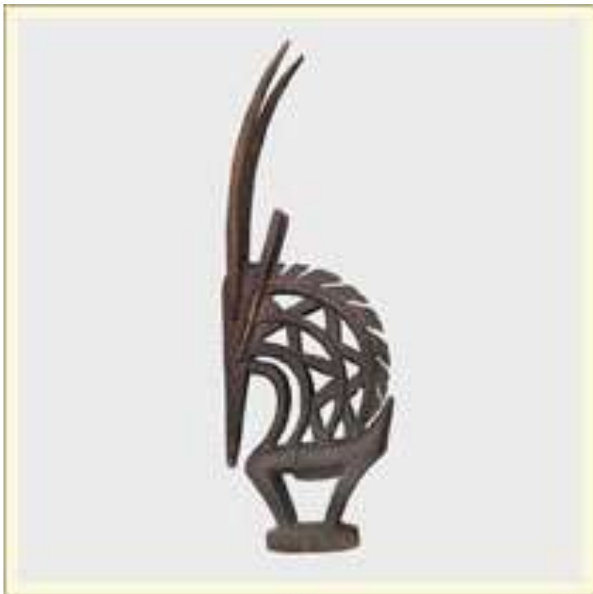
Маска-наголовник. Изображает мифическую антилопу «Чи-вара». Использовалась членами тайного мужского союза «Фла-куру» в церемониальных танцах во время земледельческих работ. Дерево, краска. Мали