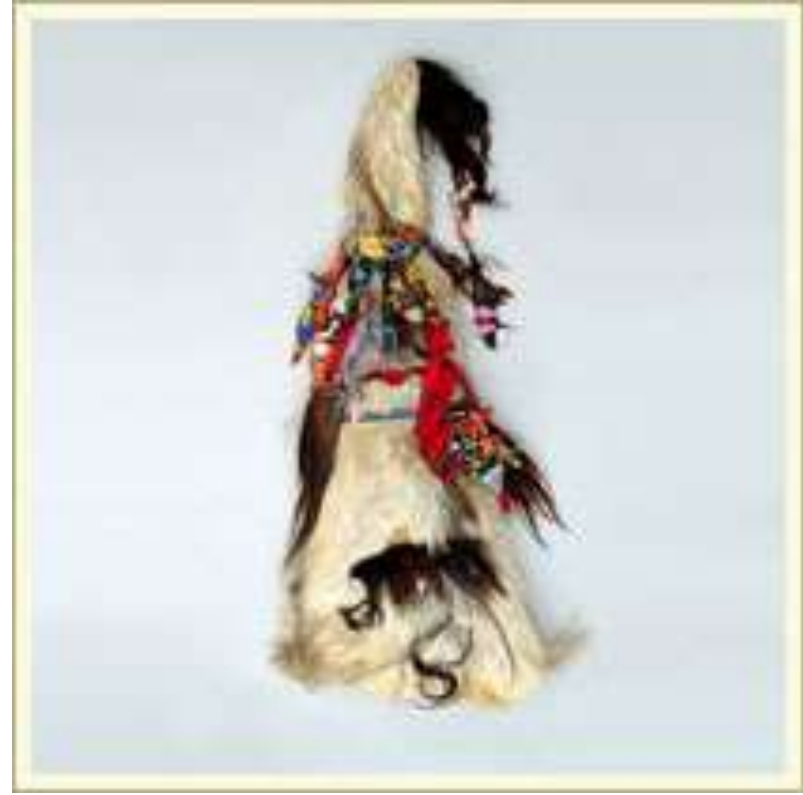
Маска волка. Атрибут мужского костюма на празднике середины зимы. Козья и овечьей шкуры, ткань. Республика Дагестан, цезы/дидойцы.