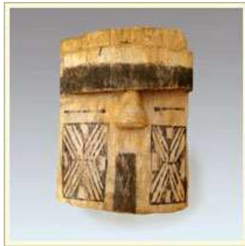
Маска-личина. Изображает духа. Используется в рыбьем танце «huvat». Дерево, краска. Бразилия, индейцы камайюра.