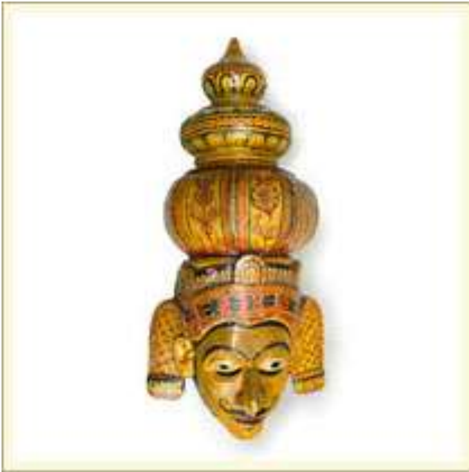
Маска-личина «Кумар» (царевич). Театр «Колам» (Шри Ланка). Дерево, краска, лак.