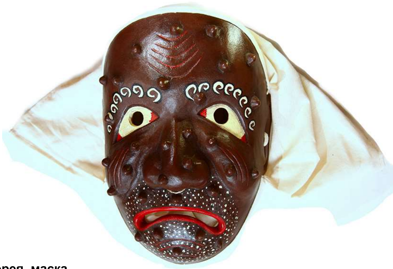
Южная Корея, маска монаха 2013 Дерево, ткань