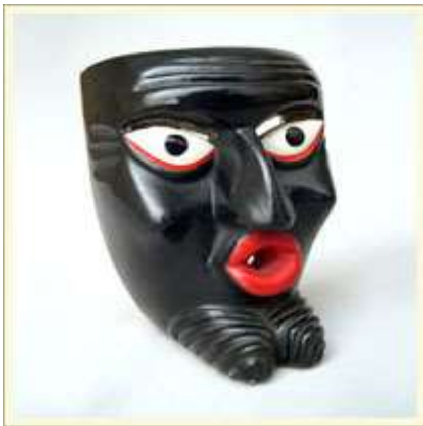
Маска-личина «Дьявол». Дерево, краска. Мексика.