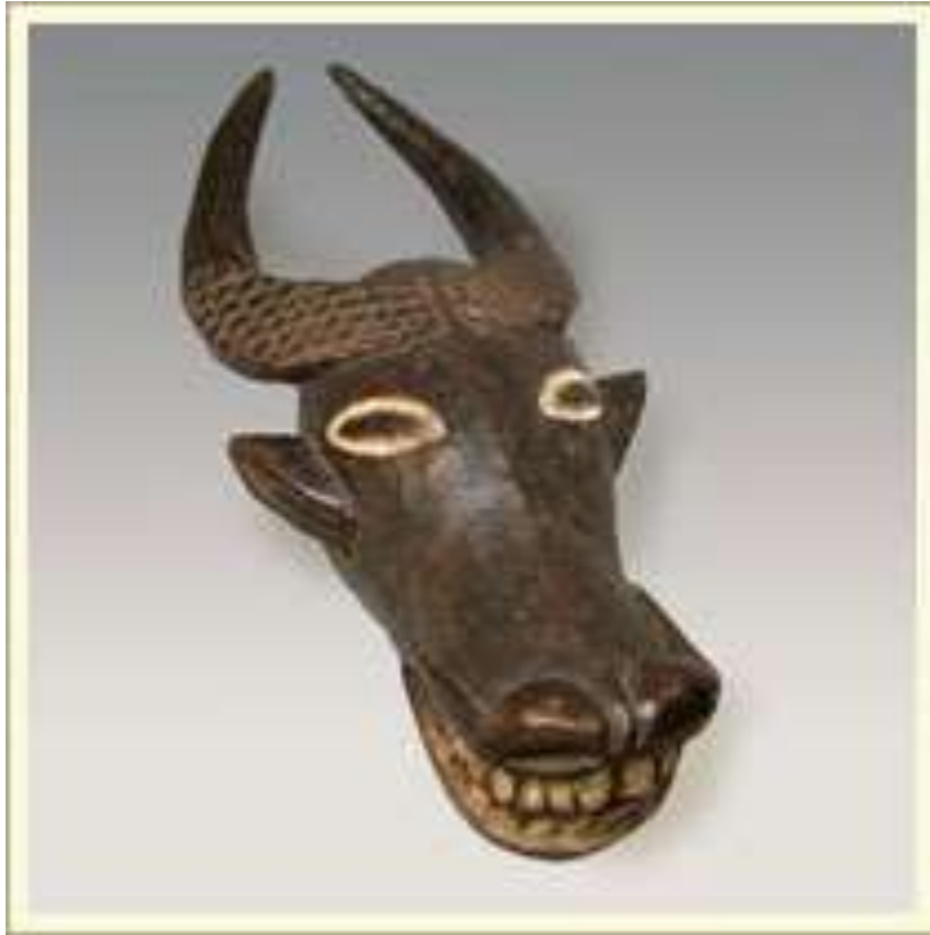
Маска-наголовник. Изображает голову буйвола. Использовалась членами тайного союза в церемониальных танцах при обрядах инициации. Дерево, краска. Камерун