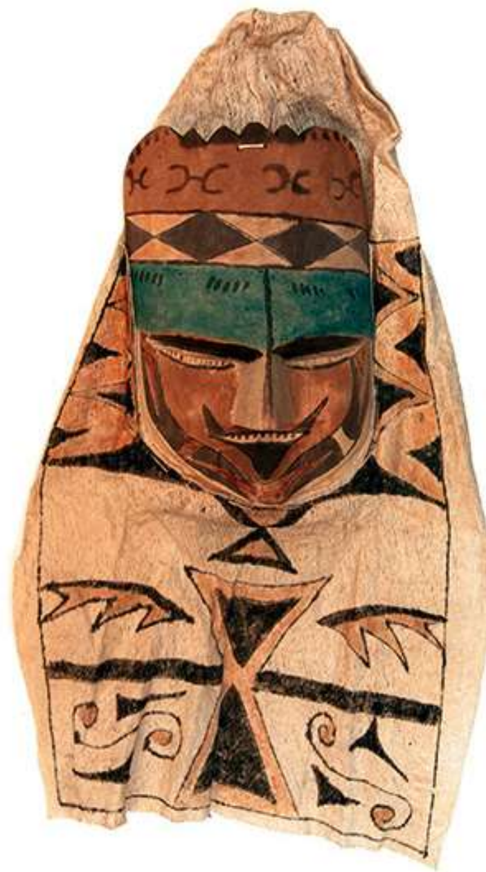
Амазония, племена Колумбии 2012 Дерево, ткань из коры дерева