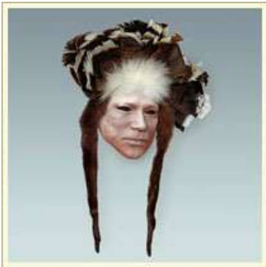
Маска-личина. Изображает мужского духа. Гипс, краска, перья индейки, мех выдры и собаки. США, индейцы потаватоми.