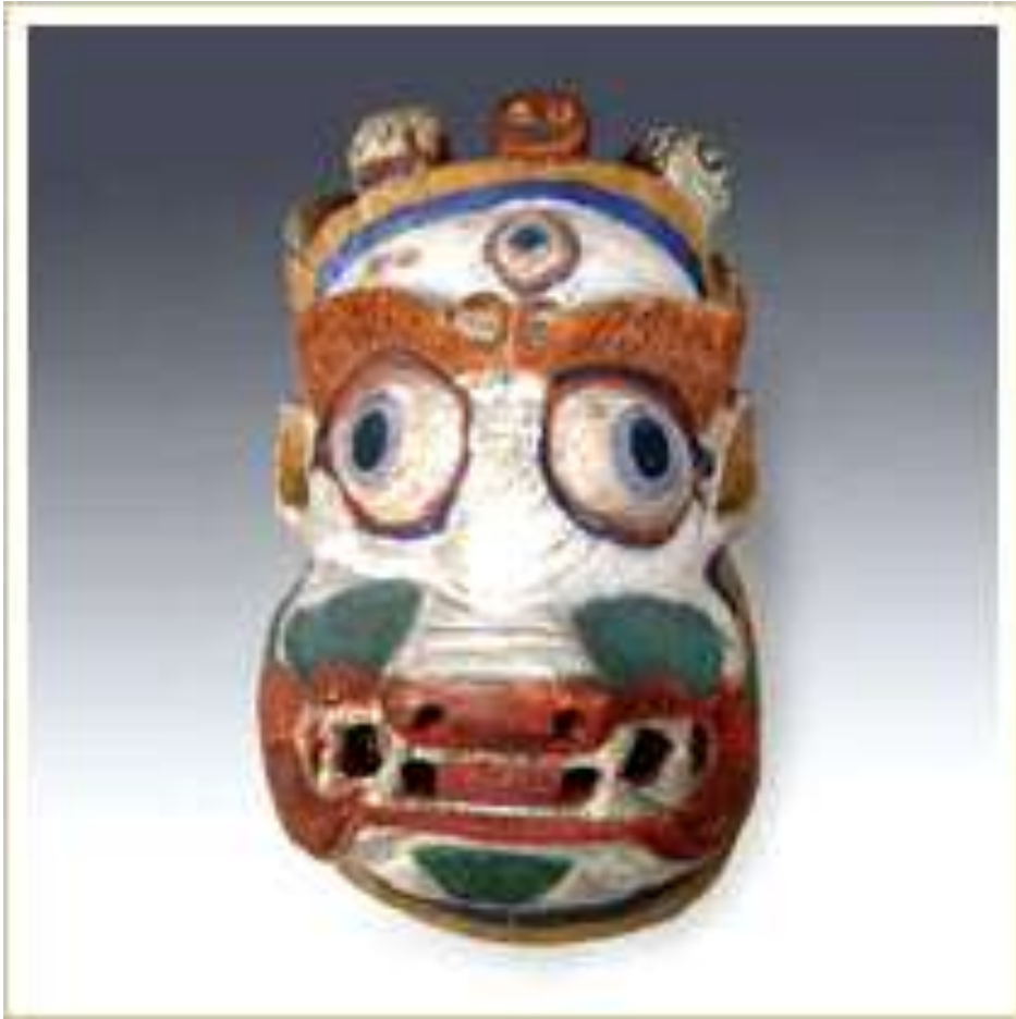
Маска-личина львиноголовой дакини (демоницы). Персонаж буддийской мистерии «Цам» (Северная Индия/Непал). Дерево, краска.