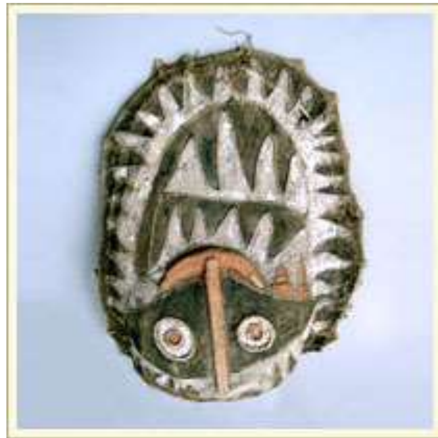
Маска-наголовник типа «эхаро» (букв. «танцевальная маска»). Изображает мифологический персонаж. Использовалась во время танцев, дополняющих главные церемонии мужского дома. Дерево, луб, краска. Юго-Восточная Новая Гвинея.