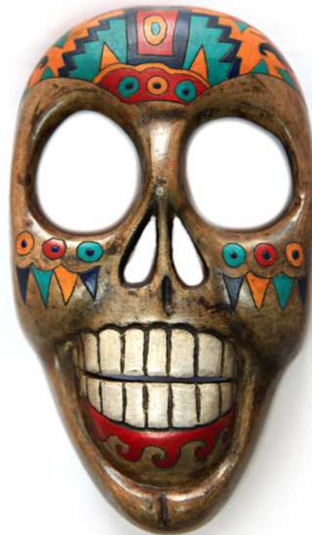
Мексика, по мотивам ацтеков 2011 Глина