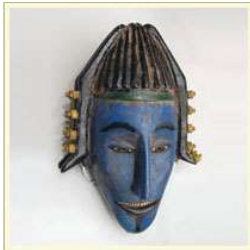
Маска шлемовидная. Изображает «Комине (Намине)» - идеальную женщину. Использовалась членами тайного общества «До» в земледельческих праздниках. Дерево, краска. Мали