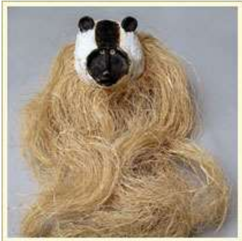
Маска-наголовник. Изображает голову обезьяны. Используется в обрядовом танце Warime. Дерево, растительное волокно, каолин, пчелиный воск, растительные красители. Венесуэла, индейцы пиароа.