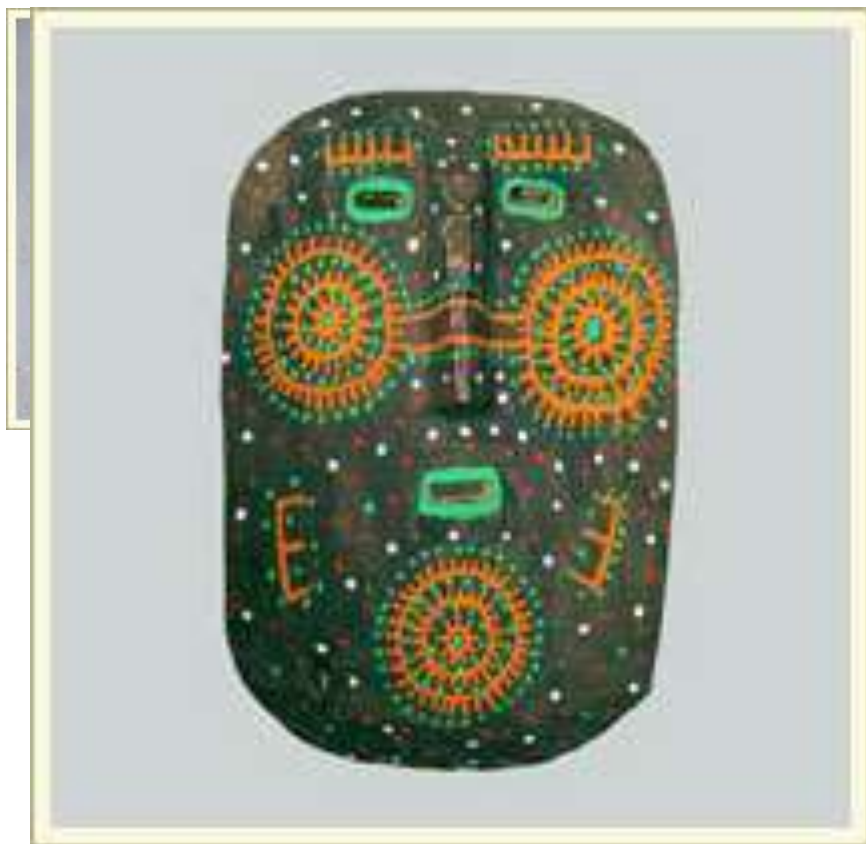
Маска-личина. Дерево, краска. Мексика.