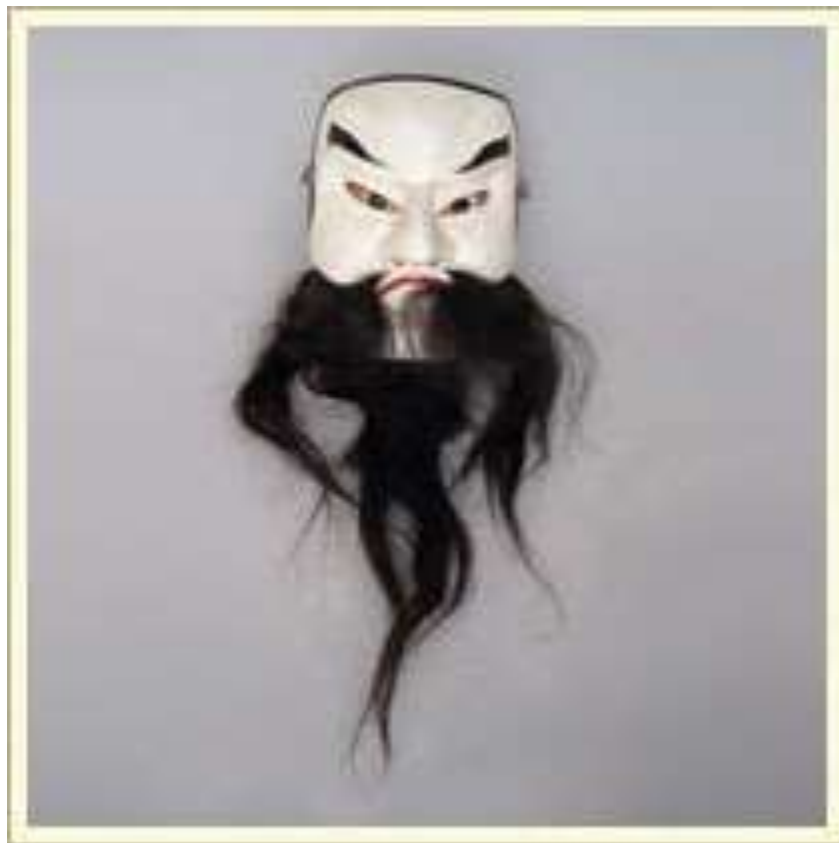
Маска-личина «Министр». Персонаж японского классического театра Но. Дерево, краска, волос, растительное волокно. Приобретена в Японии