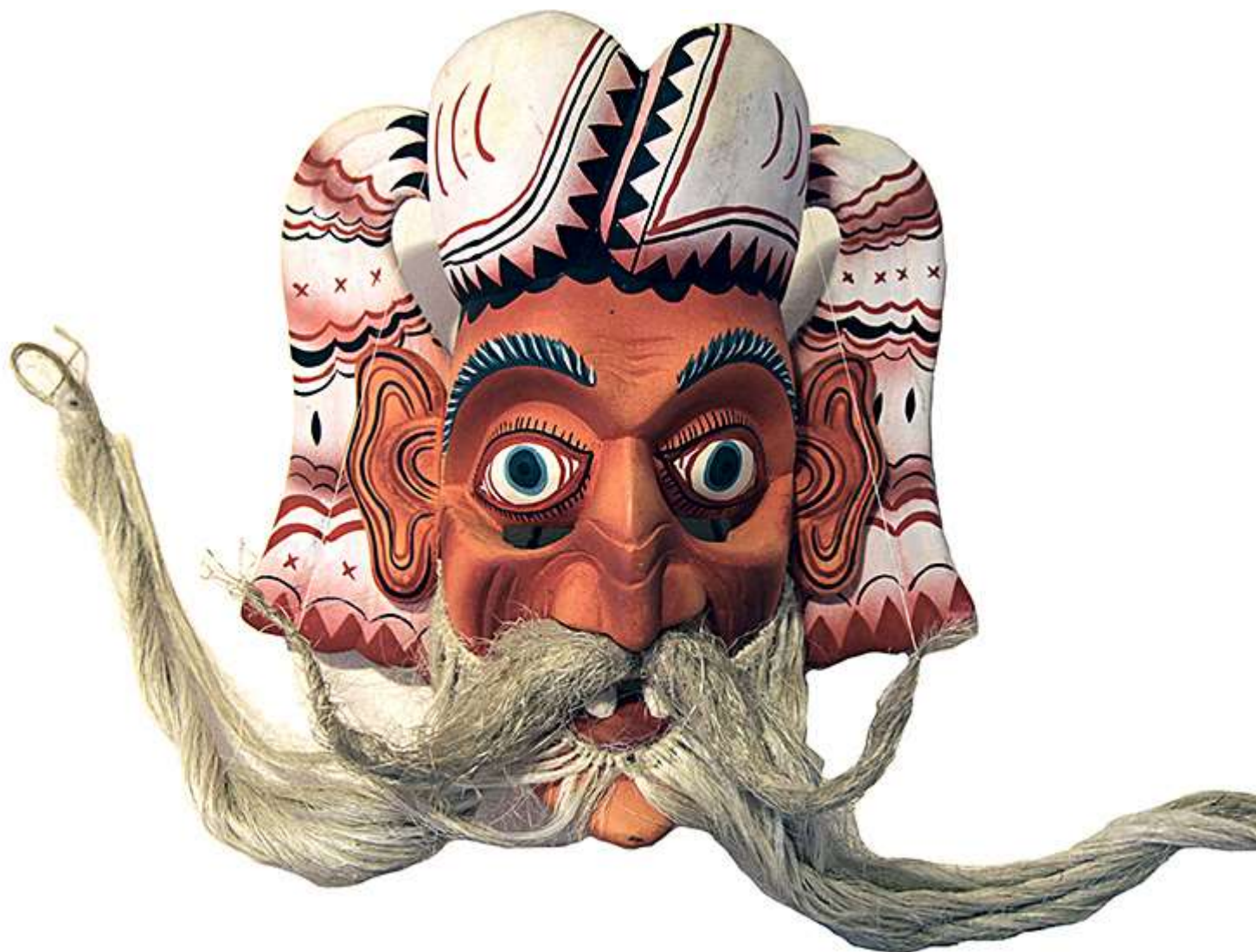
Шри Ланка 2014 Дерево, солома