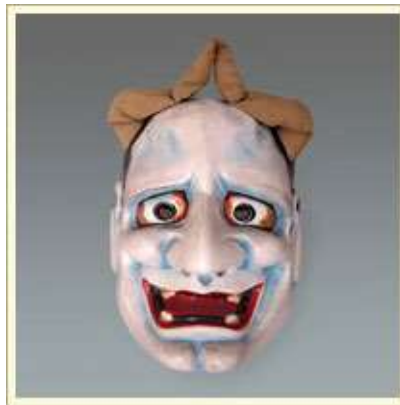
Маска-личина чудовища, изображает черта или гнев. Персонаж японского классического театра Но. Дерево, краска, ткань, растительное волокно. Приобретена в Японии