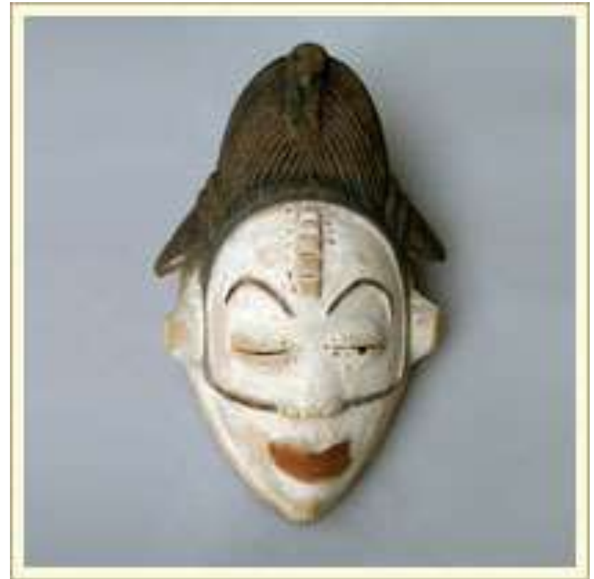
Маска-личина. Изображает дух умершей женщины. Использовалась при обрядах погребения. Дерево, краска. Габон.