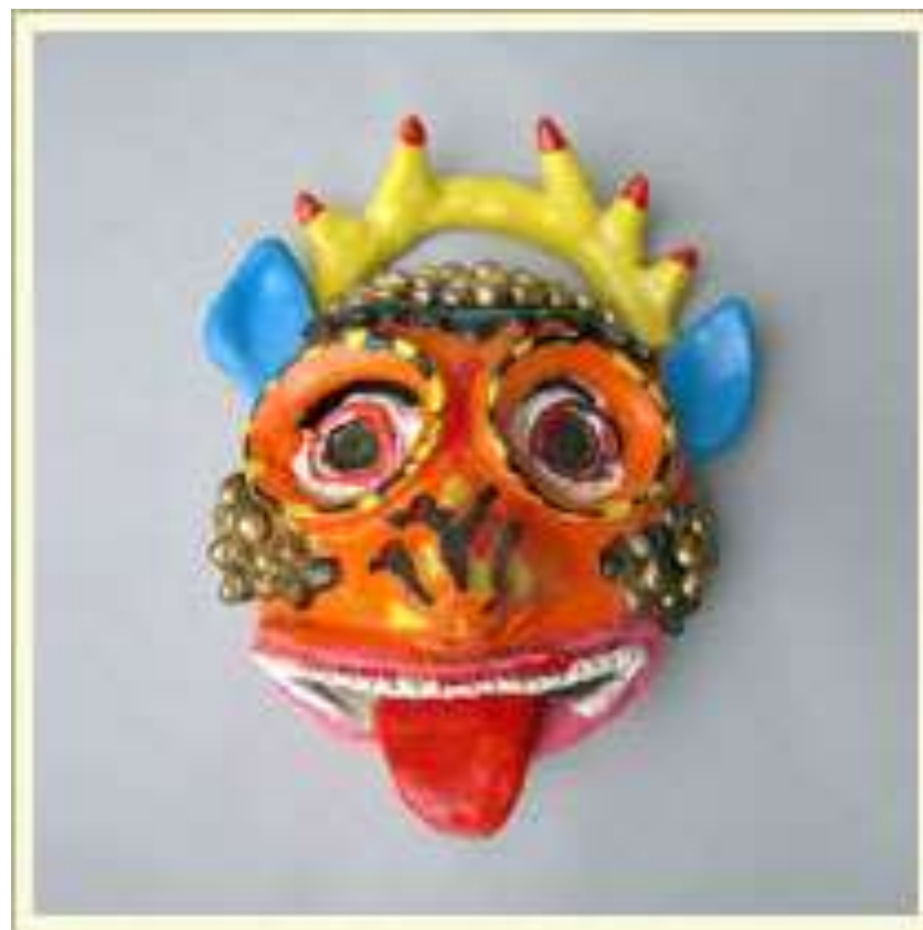
Маска-личина карнавальная. Изображает чудовище. Глина, краска. Мексика.