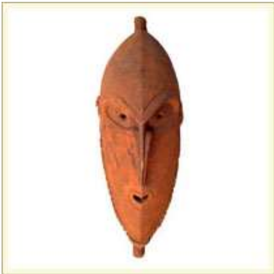
Маска-личина. Изображает мифического предка. Вероятно, использовалась в тайных церемониалах мужчин. Дерево, краска. Р. Сепик, о-в Новая Гвинея.