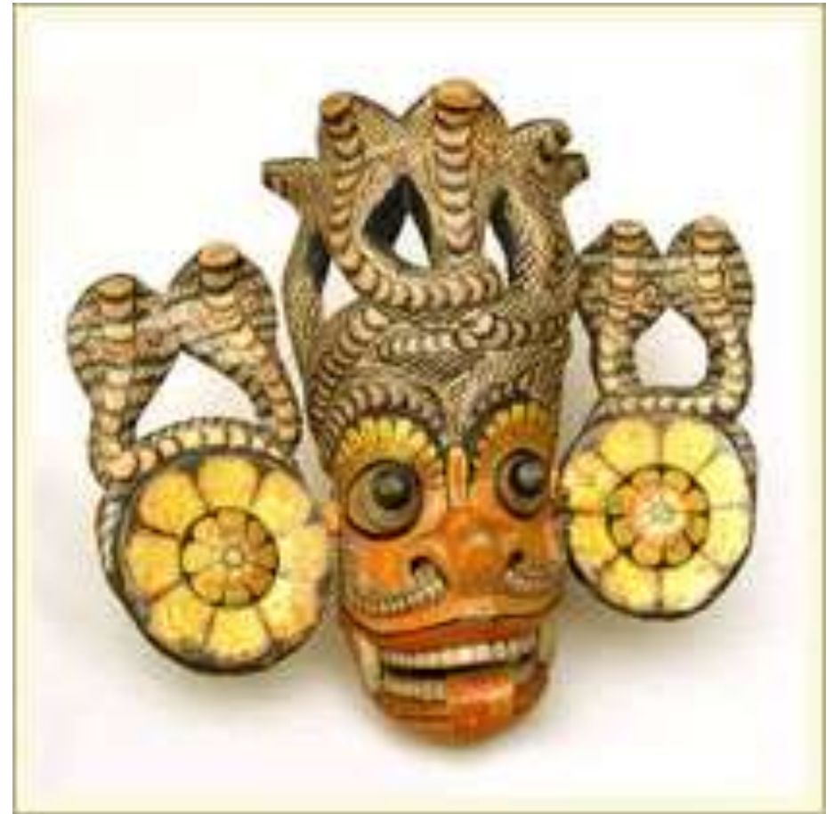
Маска-личина «Нага-рясса» (Змеинный Демон). Театра «Колам» (Шри Ланка). Дерево, краска, лак.