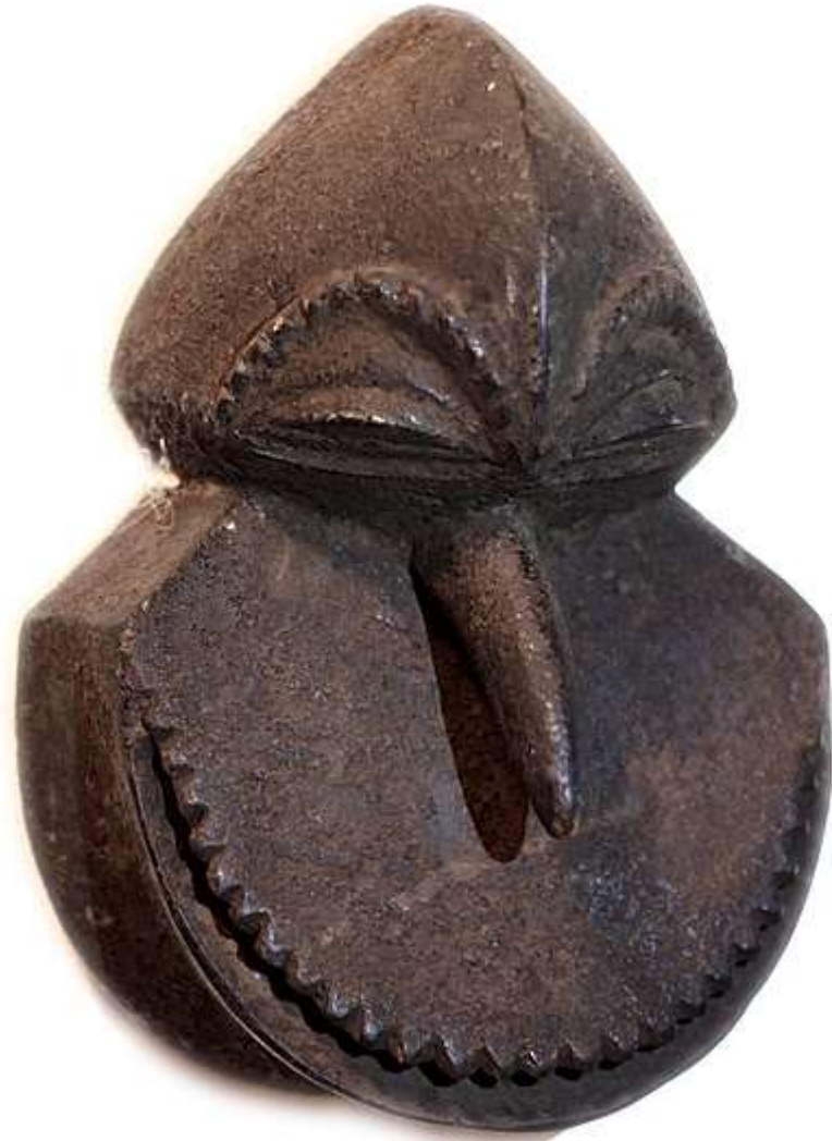
Конго - Уганда 2013 Дерево