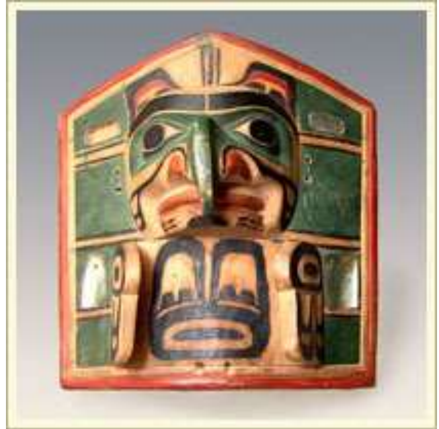
Панель маски-наголовника с изображением Ворона. Использовалась в ритуальных плясках. Дерево, краска, перламутр. Канада, индейцы квакиютль.