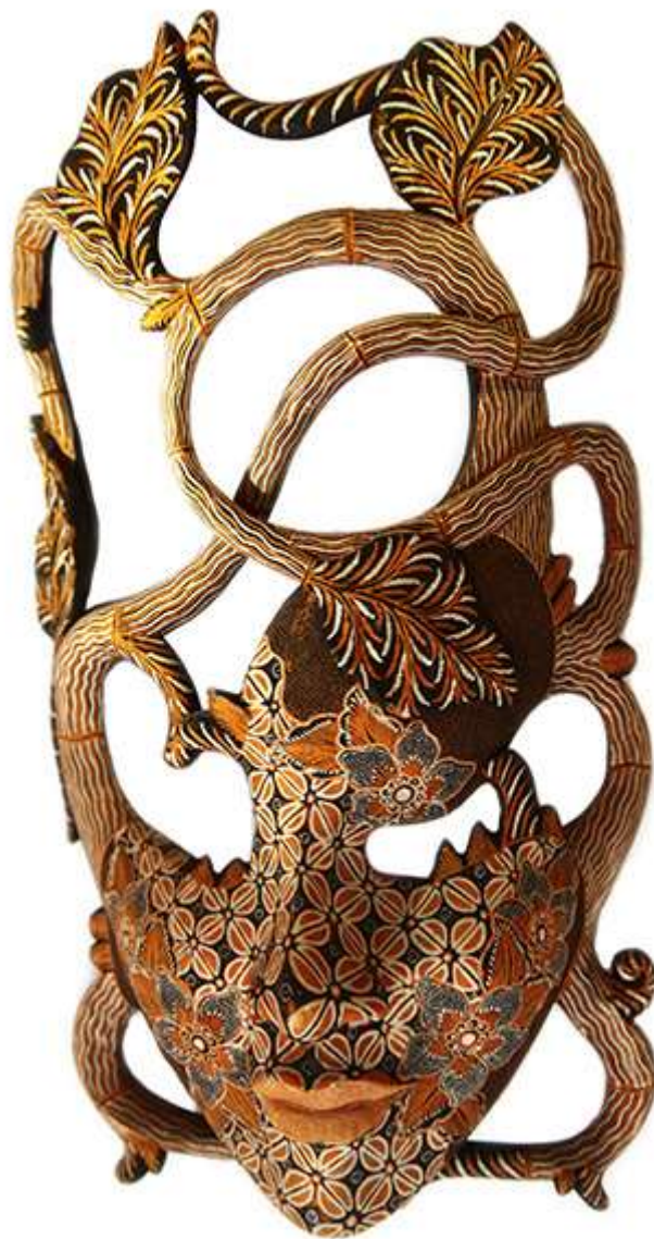
Бали 2013 Дерево