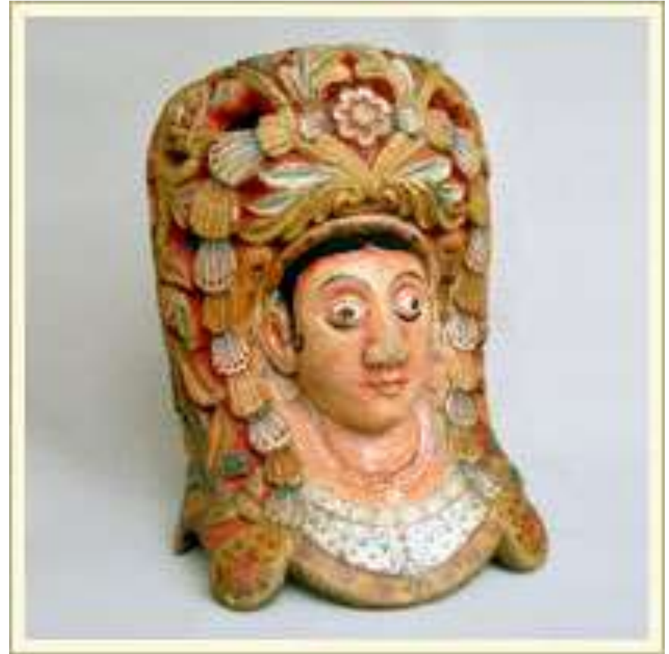
Маска-личина царицы (или богини). Театр «Колам» (Шри Ланка). Дерево, краска, лак