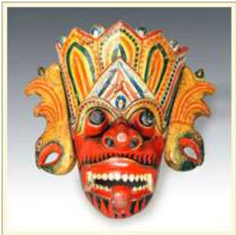
Маска-личина «Гурулу-рясса» (мифическая птица Гаруда) в гневной ипостаси. Театр «Колам» (Шри Ланка). Дерево, краска, лак.