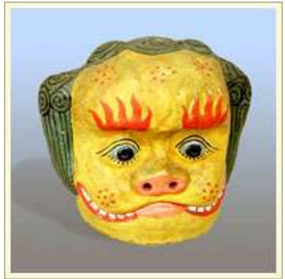
Маска шлемовидная «Хуан-ши-дза-тау» - священное буддийское животное лев или небесная собака. Персонаж народных театрализованных представлений, проводившихся в храмах Северного Китая. Папье-маше, краска.