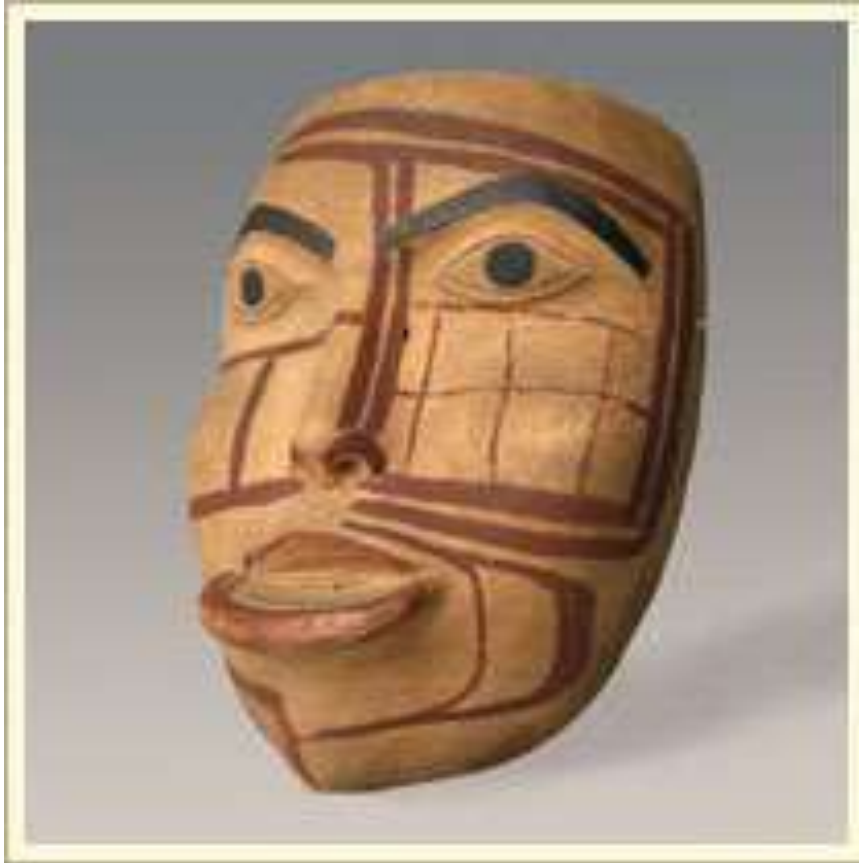
Маска изображающая женского духа-помощника шамана. Дерево, краска. Аляска (США), индейцы