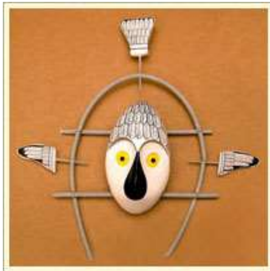
Реплика маски совы из археологических раскопок. О-в Кадьяк (Аляска, США), эскимосы алутиик. Дерево, краска, пластмасса.