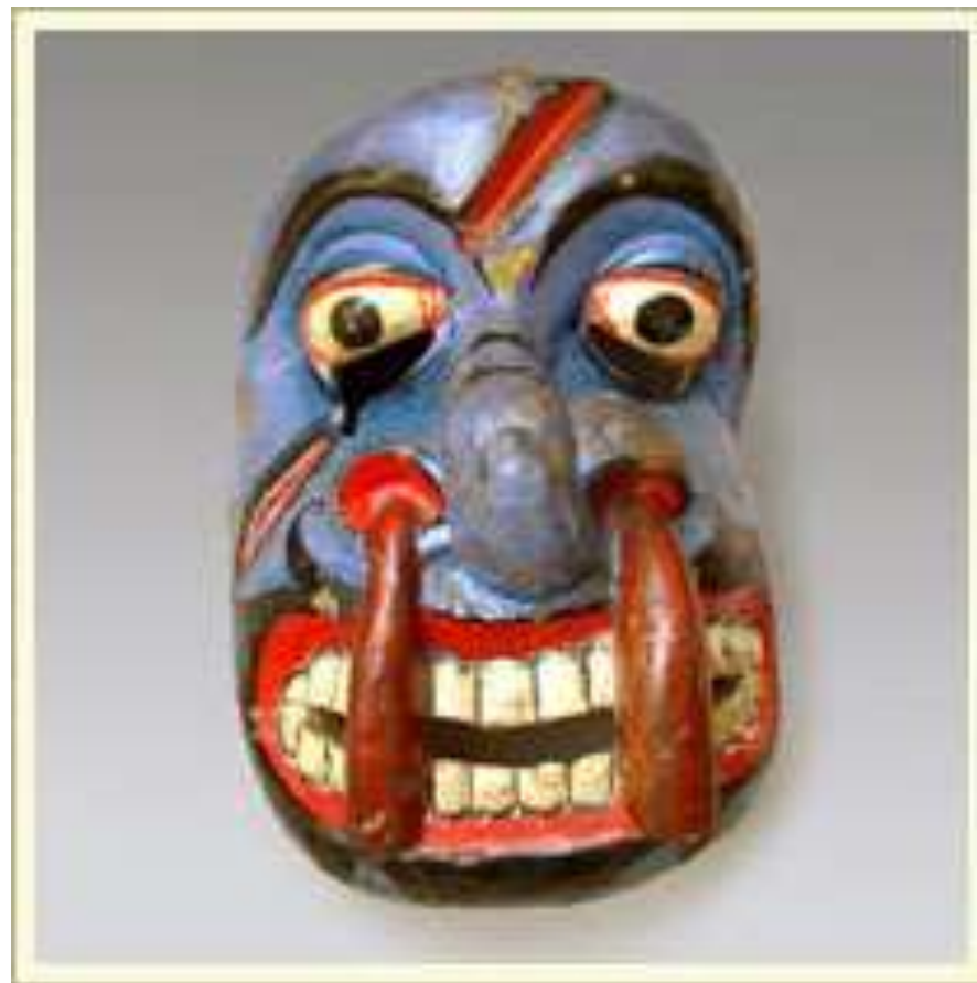
Маска-личина одного из демонов болезни. Персонаж демонического культа сингалов (Шри Ланка). Употребляется в ритуалах излечения больного; может быть употреблена и в театральном представлении для изображения раненого с рассеченным ртом. Дерево, краска, лак.