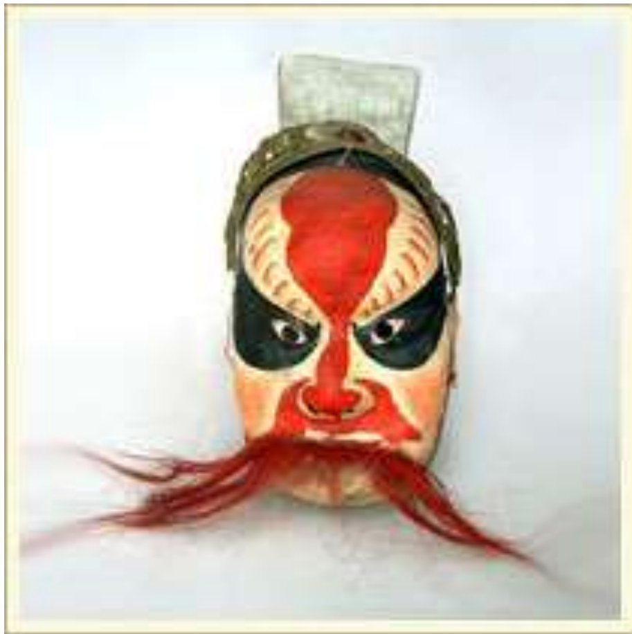
Маска шлемовидная «Мыньлянь». Историко-литературный персонаж сунского времени (960-1279 гг.). Папье-маше, краска, металл, шёлк, волос, растительное волокно.