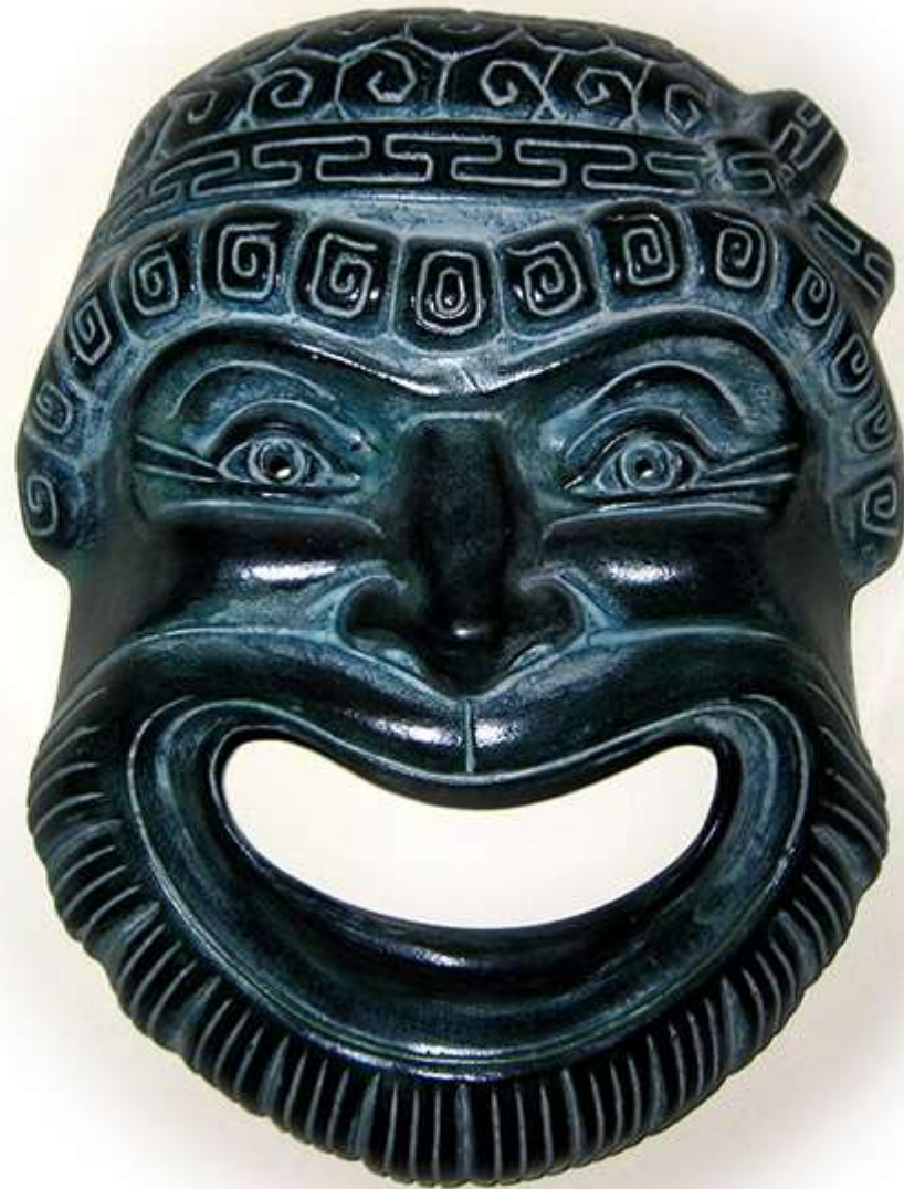
Греция, Афины 2008 Гипс