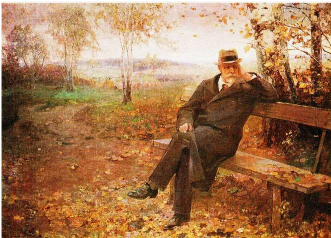
«П.И. Чайковский на Украине»