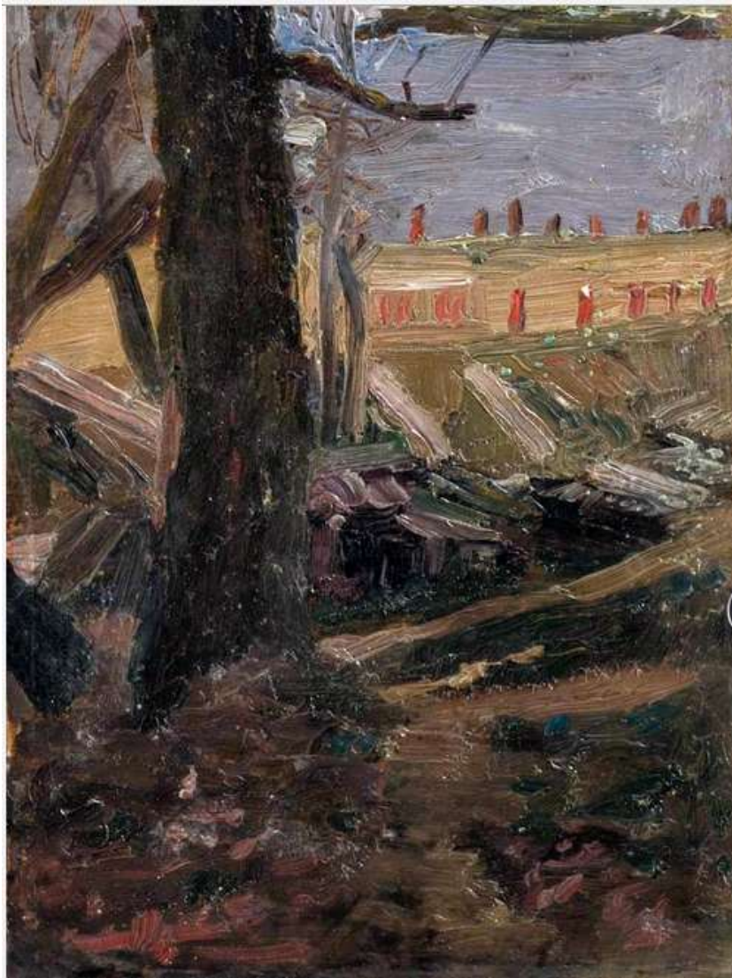
«На днепровском причале»