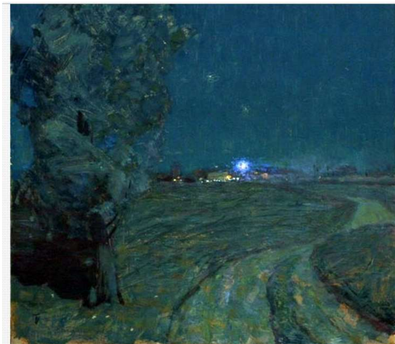
«Дорога к станции»