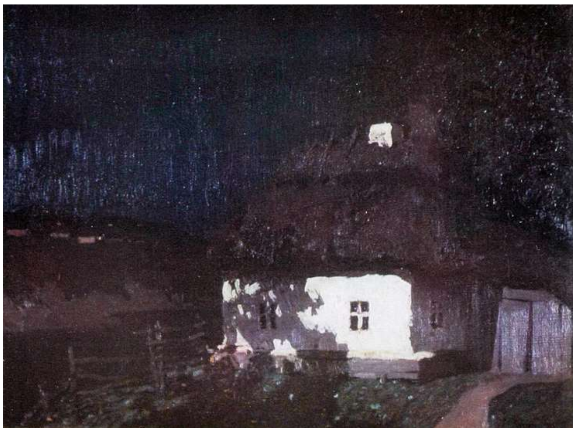
«Хата в лунную ночь»