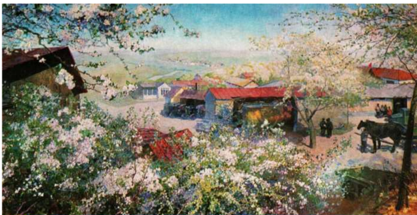
«Колхоз в цвету»