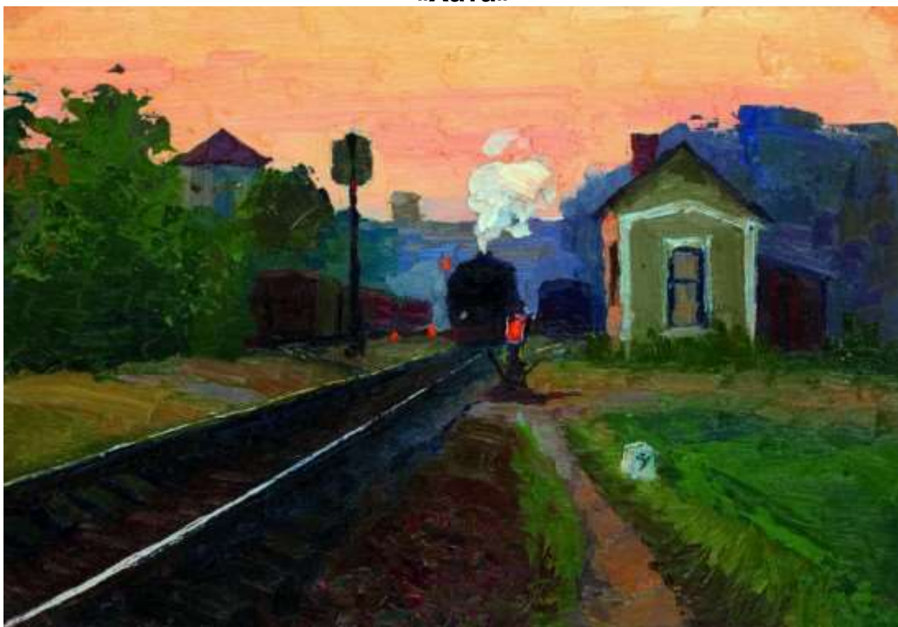
«Поезд на станции»