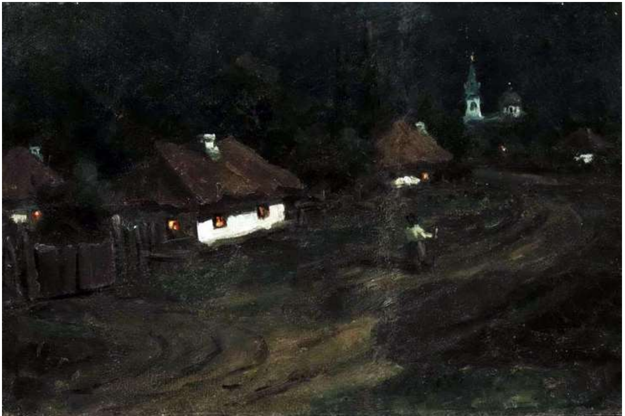
«Сельская улица в лунном свете»