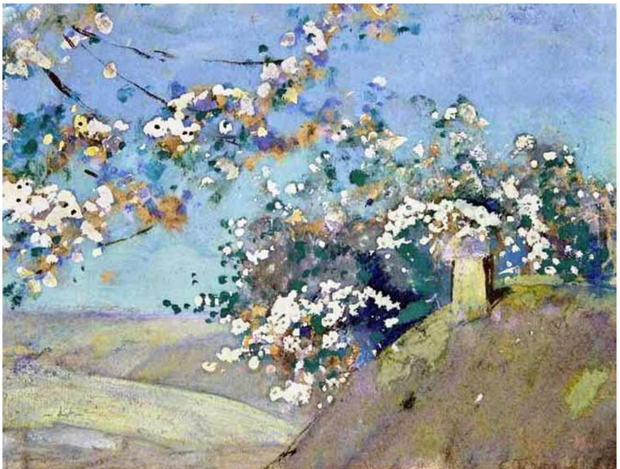
«Ветка цветущей сливы»