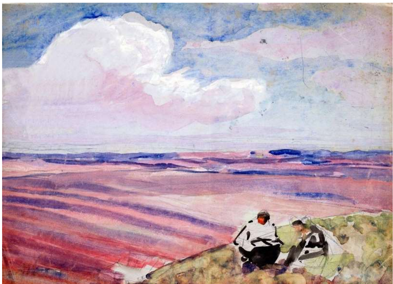
«На весенних полях»