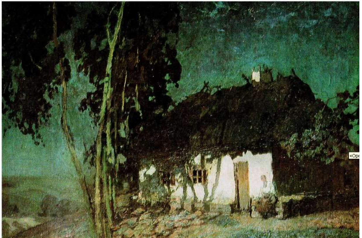
«Марусина сказка. Богуславка.»