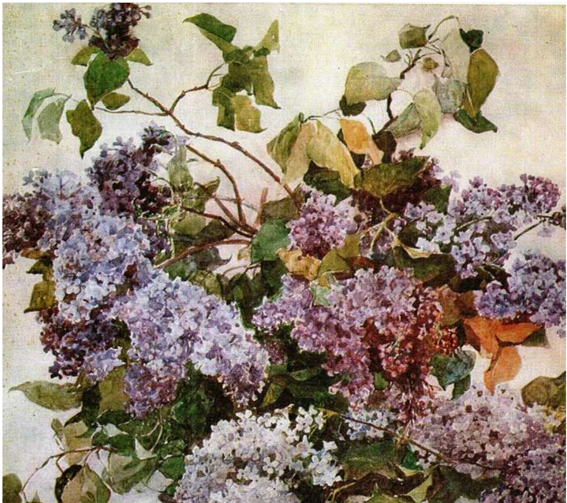
«Сельская улица в лунном свете»