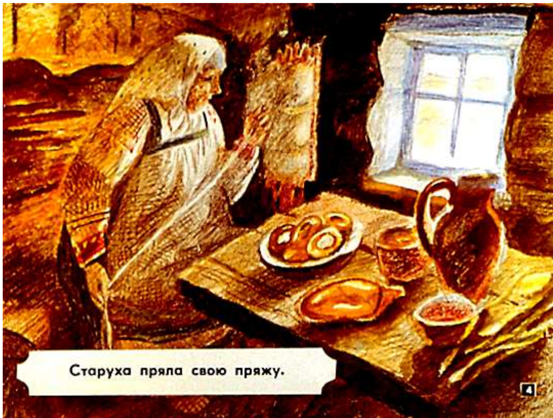
Старуха пряла свою пряжу.