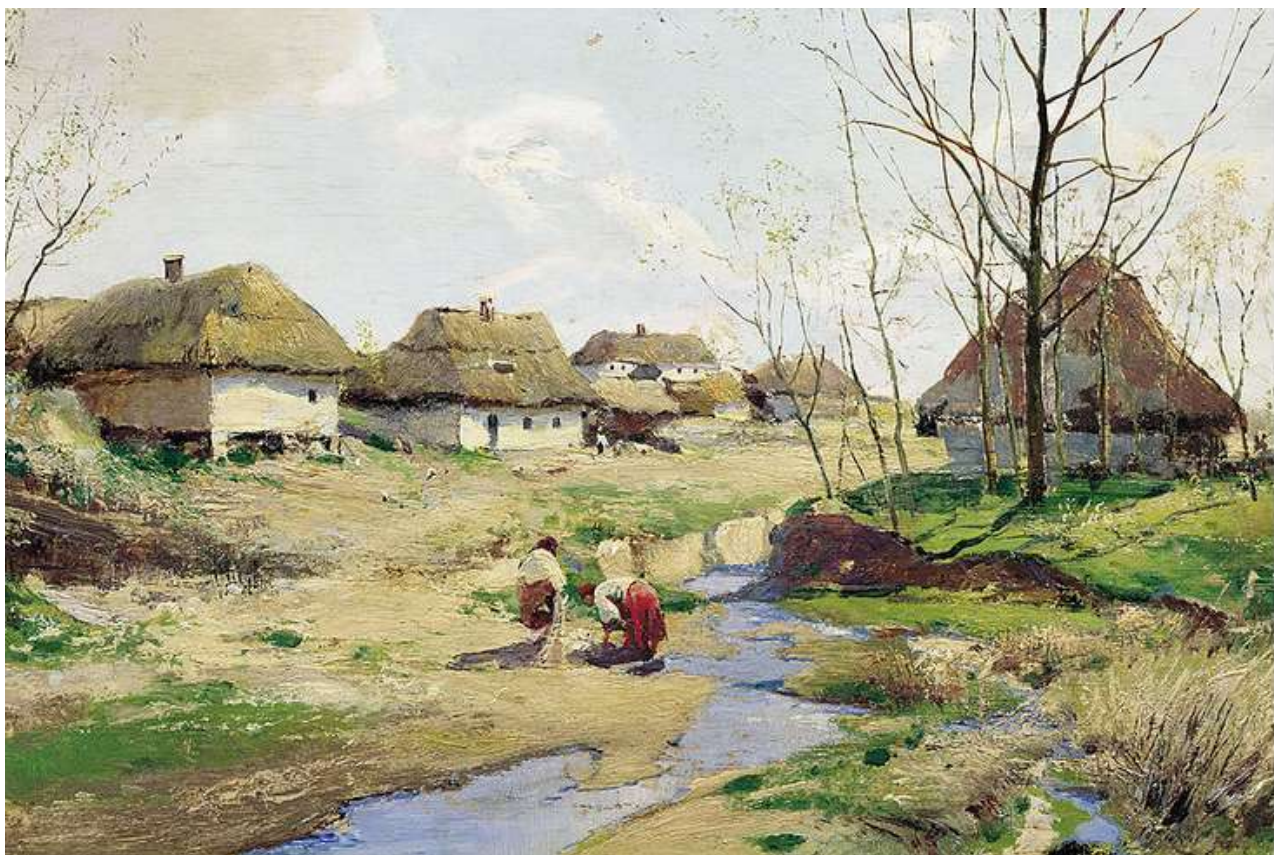
Весна в Україні.