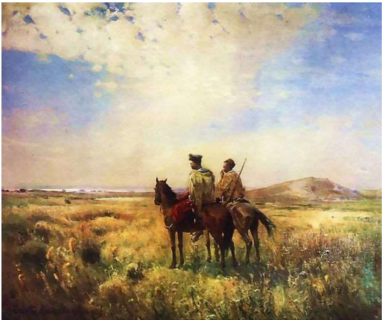
Сторожа запорозьких вольностей