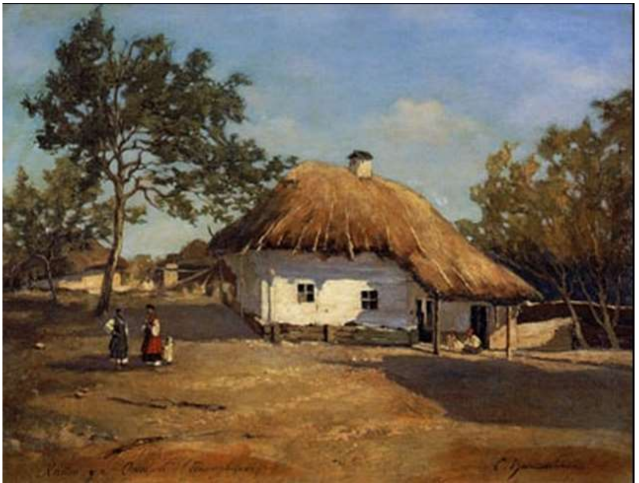
Хата в Опішні